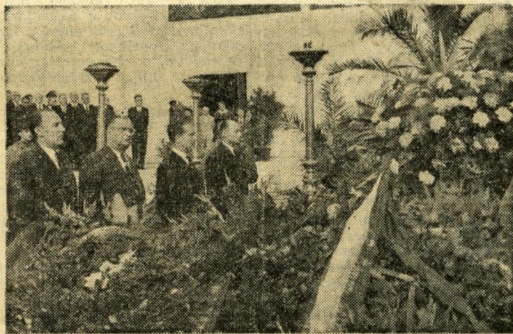
Kádár János, Münnich Ferenc, Fock Jenő, Biszku Béla elvtársak a ravatalnál.

Fájdalmas veszteség érte pártunkat, a magyar munkásmozgalom, a magyar nép pártját. Attól az elvtársunktól kell megválnunk, akit kimagasló tudása, tehetsége, rendkívüli aktivitása és szenvedélyes hite 40 esztendőn át a párt és a forradalmi küzdelem vezető helyére állított. Élete annyira összenőtt a párt egész életével és dicső történetével, munkájával, harcával és személye oly közel állt valamennyiünkhöz, hogy eltávozását fájdalmas sebet okoz minden magyar kommunistának, a párt minden hű tagjának.