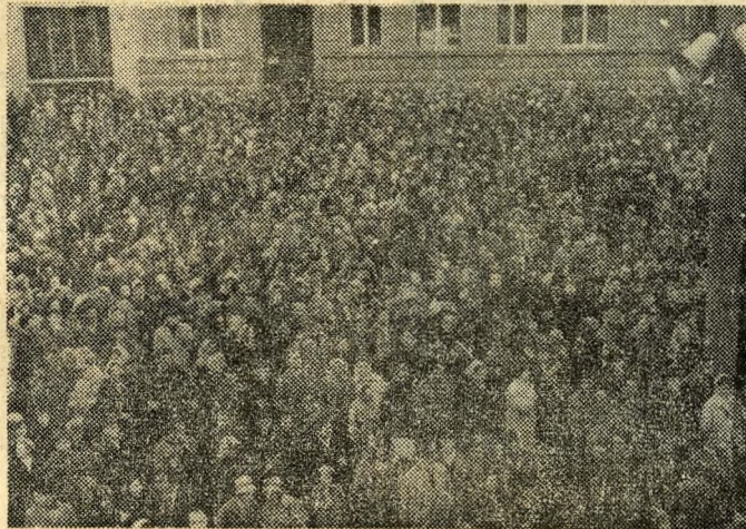
A híd környékén is sok ezer ember várta az ünnepélyes avatást