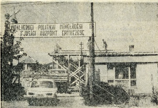
A Királyerdő hosszú ideig elmaradottságával, a kulturálódás kérésével Csepel fekete foltja volt. A homokra épült kertes házak évről évre válnak csinosabbá, kulturáltabbá. S ezzel tart lépést az évek óta igényelt művelődési centrum építése: hazánk felszabadulásának 30. évfordulóján a 25 ezres Királyerdő már csak földrajzi értelemben lesz a város pereme, átadják rendeltetésének a művelődés, a tanulás, a hasznos időtöltés, a kulturált szórakozás nagyszabású intézményét.