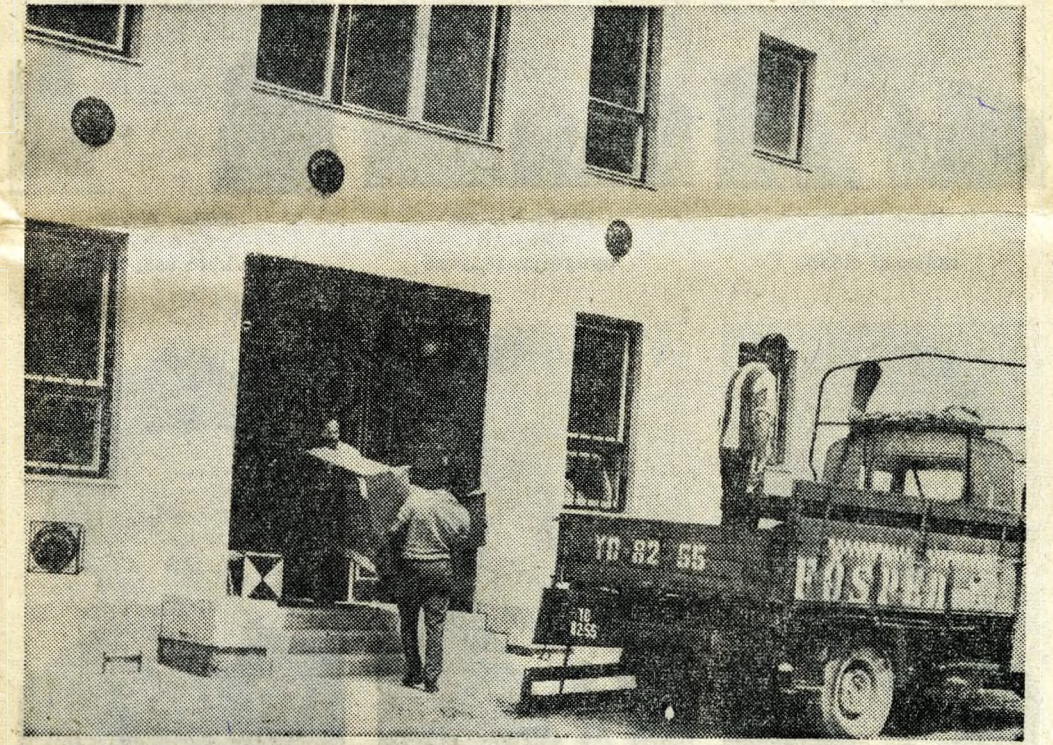
Lapunk első oldalán a még építés alatt álló lakóházakról készült a fénykép. Ez a felvétel a már elkészült három épület és a boldog költözödések egyikét láthatjuk: a CSM második lakótelepének első lakói a kulcsátadás után már a bútorokkal megrakodott teherautókat kalauzolják a boldog családi élet színhelyére.