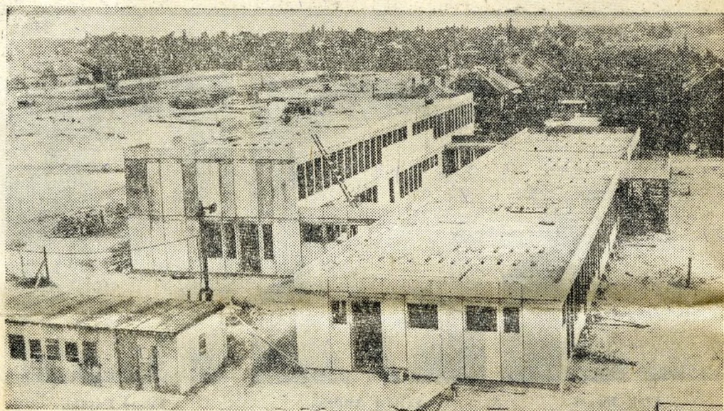
A Szentmiklósi úti emeletes lakóházak között eltöppül ez az épület: a Csepel Művek lakótelepe mellett készül, s rövidesen befejeződik a 60 férőhelyes bölcsőde és a 100 gyerekek naplali otthont adó óvoda építése.

Össze sem hasonlítható Csepel építkezése például az óbudaival. A méretek jóval kisebbek, de a célok legalább akkorák. Az életkörülmények javításáért, a színvonalasabb ellátásért, a nívósabb kultúrálódásért dolgoznak a tervezők, a beruházók, a kivitelezők. Hogy mi készül? Lakóházak, óvodák, bölcsődék, élelmiszerüzletek, kenyérgyár, kultúrház, nyomda... A beruházók között a Csepel Művek a tanács és még több más intézmény szerepel.