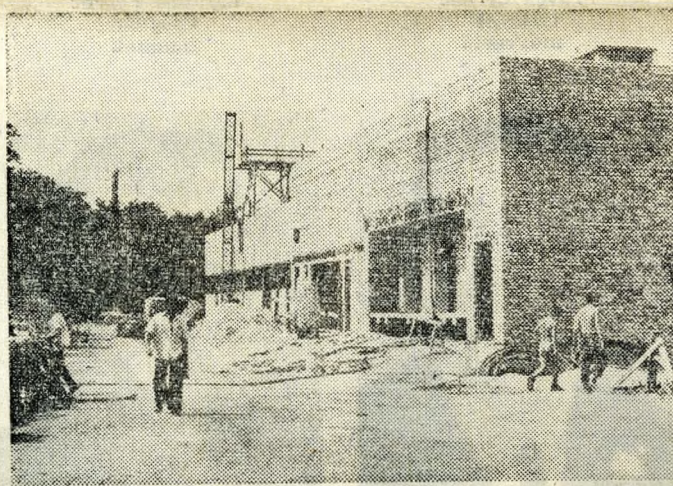
A Magyarországon, a Ludas Matyi, a Lobogó és még sorolhatnánk, hány népszerű újság nyomdája a Zrínyi Nyomda. Ez a fontos intézmény költözik ki hamarosan az V. kerületi Marx térről Csepelre: már javában épül a politikai, kultúrpolitikai szempontból is igen fontos létesítmény a csepeli Rákóczi úton.