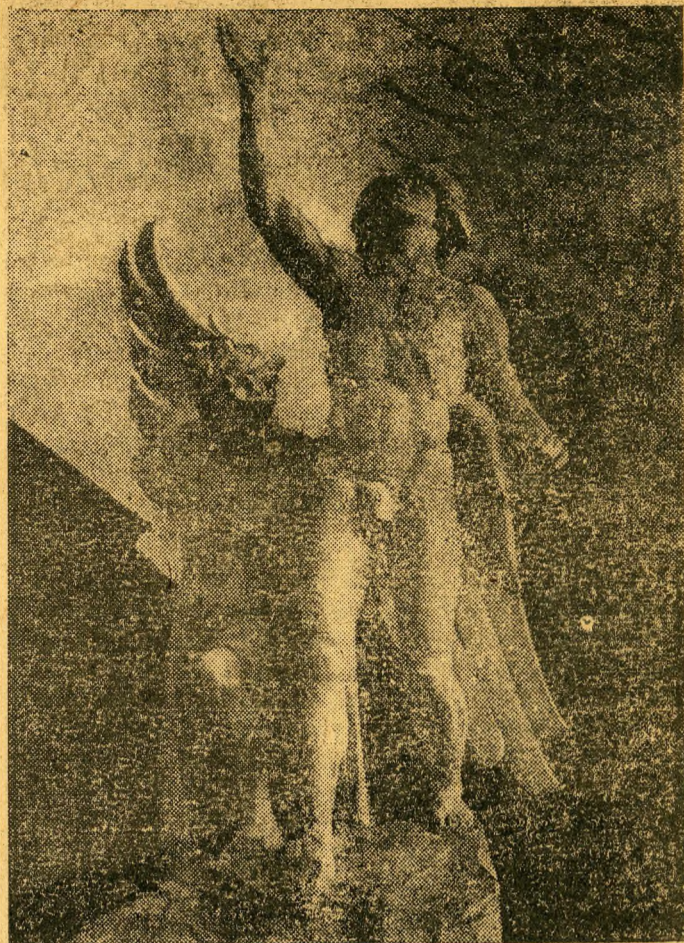
Kisfaludi-Stróbl Zsigmond Madách-szobrának nagy gipszmin-tája. Bronzbaöntése a háború utánra vár. Az emlékmű talapzata már készen áll a Vilma királynő-út végén álló virágos parkban.