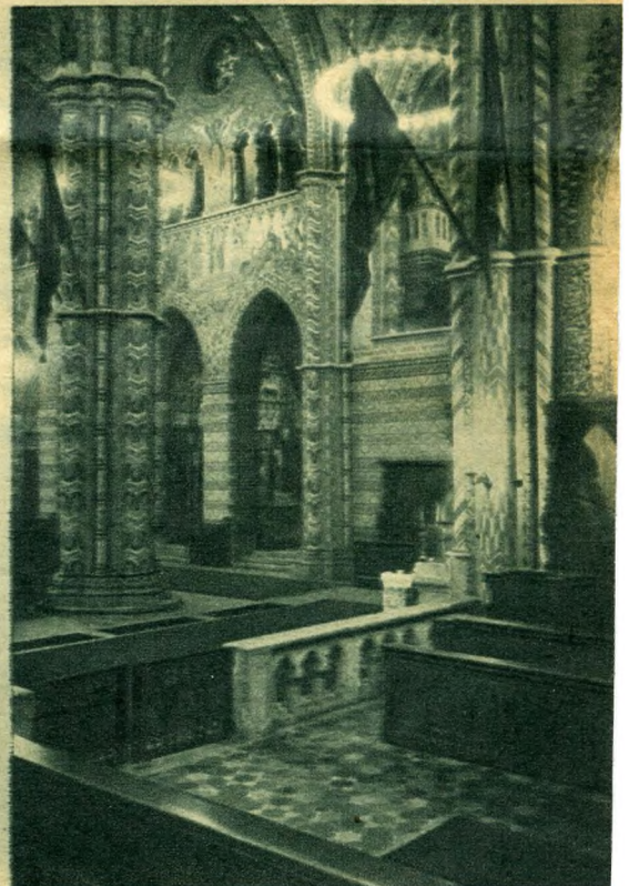
Részlet a főhajóból