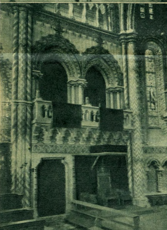
A királyi erkélyek Az egyik mellékoltár