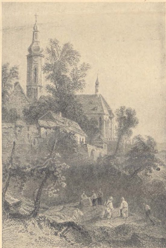
A budai Dunaparton 1842-ben (W. H. Bartlett rajza)

Sétálunk a Duna partján s belélegezzük a budai hegyek fűszeres illatát. Ezeket a hegyeket tán sohasem únjuk nézni. A földi paradicsom panorámája ez, amelyről a Honművész ilyenformán beszél: „Ha festész volnék, mindenesetre ecsethez nyúlnék... A