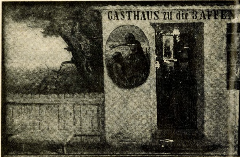
„A 3 Majomhoz” cégérképe. (A harmadik majmot a tükör pótolta)

A sermérő cégér legősibb formája a láncon lógó kék golyó volt. A Kék-golyó utca a hasonló nevű, és még a har-