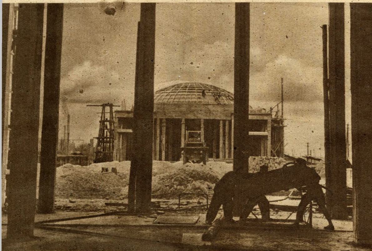
FELÉPÜLT A PESTI VÉGÁLLOMÁS KUPOLACSARNOKA a Kerepesi-út mellett. A kupolán már tetőfedő kőművesek dolgoznak