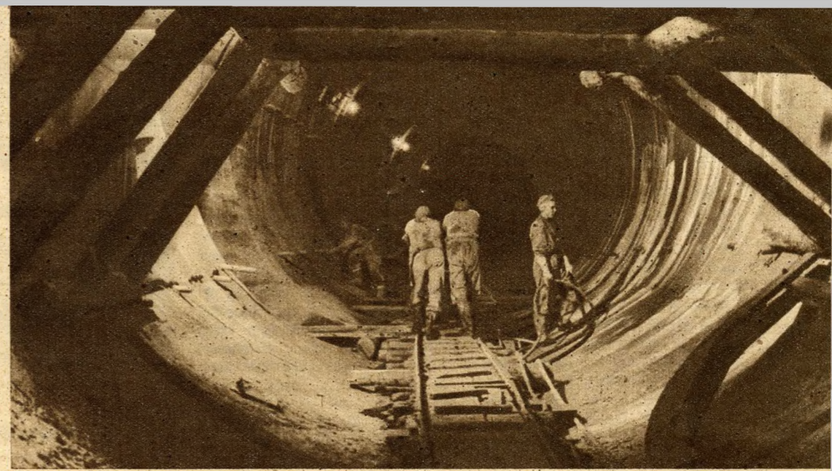
A VERMEZŐ ALATT. A földet robbantással termelik ki és csilléken szállítják a felszínre

A Déli vasúttól a Népstadionig tizenhat perc lesz a menetidő; mi gépkocsin fél óra alatt tetük meg.