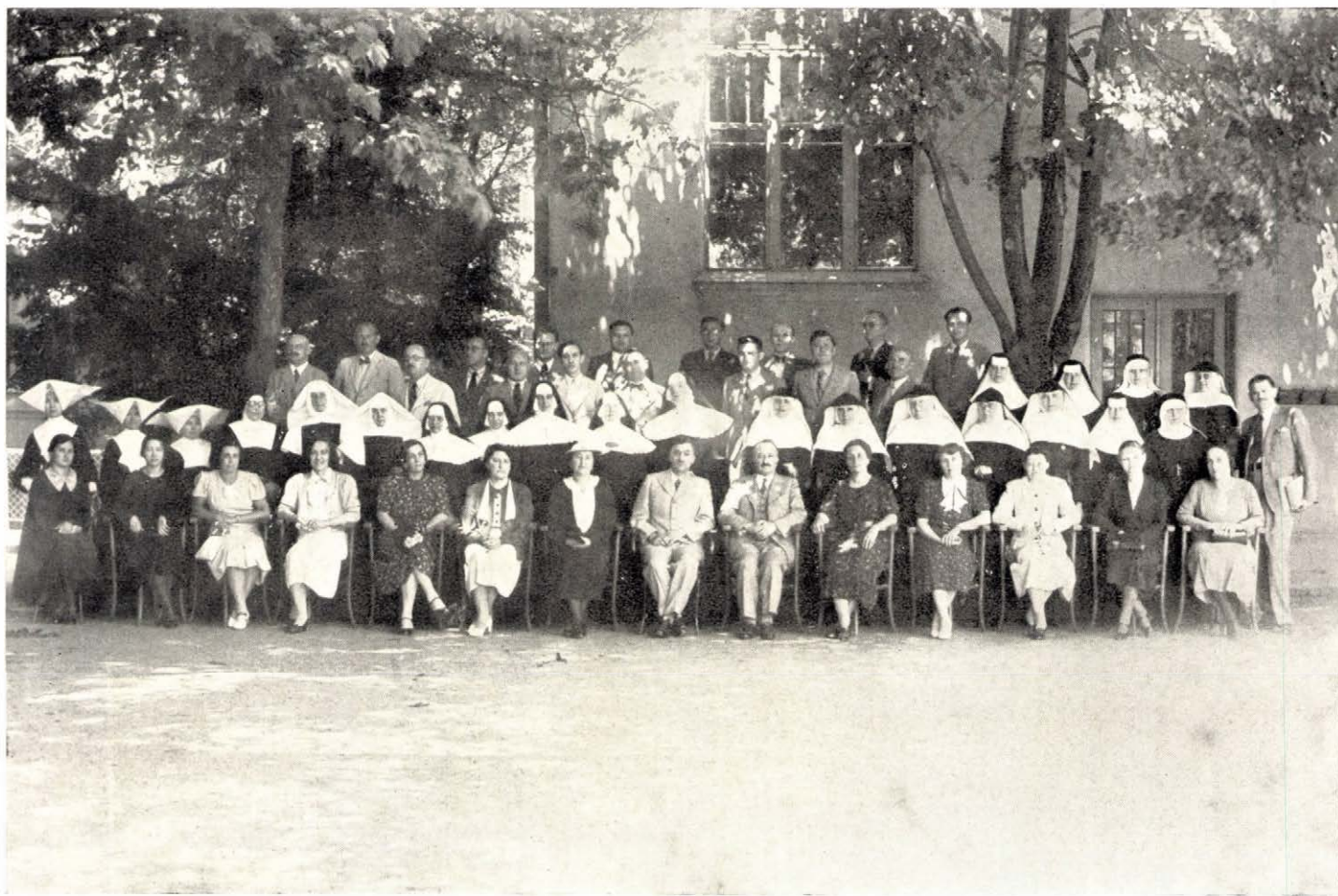
A történelem-, alkotmánytan- és közgazdaságtan szakos tanárok nyári szakértekezletének résztvevői 1937. VI. 30.—VII. 3.