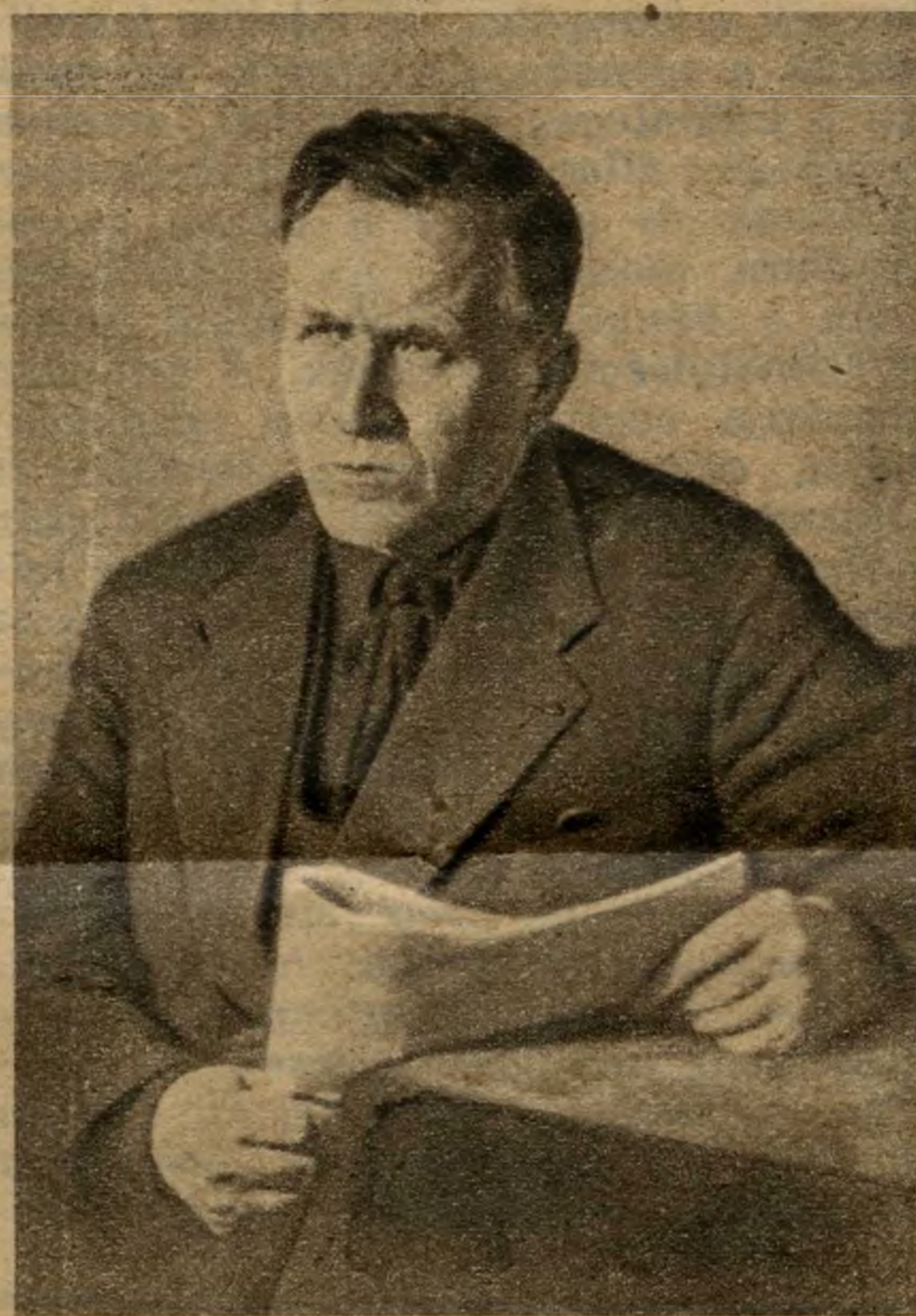
Iván Pavlovics Bargyin akadémikus

Szeretettel köszöntjük szovjet vendégeinket, várjuk, hogy a magyar-szovjet barátság hónapjában átadják nekünk tudásuk legjavát, várjuk, az egész dolgozó magyar nép várja a szocializmus országának küldötteit, hogy további erőt, lendületet kapjon tőlük a szocialista Magyarország és szocialista kultúra építéséhez.