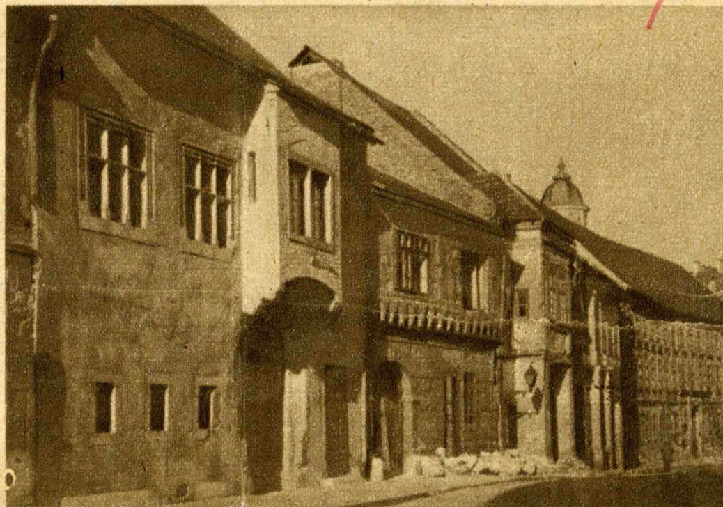
Az Országház-utca 18. és 20. sz. házak középkori homlokzata

Budám nem tapasztalható ez a zsúfoltság. A város varázsa elsősorban abban a józan, egyszerű, őszinte építőszellemben van, mely minden házában megvalósult, utcaképeiben kikristályosodott. A város alaprajza és utcahálózata ma is olyan, mint sokszáz esztendővel ezelőtt. A hosszanti utcákat terek és keskeny síkátorok tagolják. A legtöbb gótikus elemet a házak kapualjai mélyén megbújó ülőfülkék, ajtók, a homlokzatok kapui és ablakai őrzik. Gyakori a gyámköveken nyugvó erkély