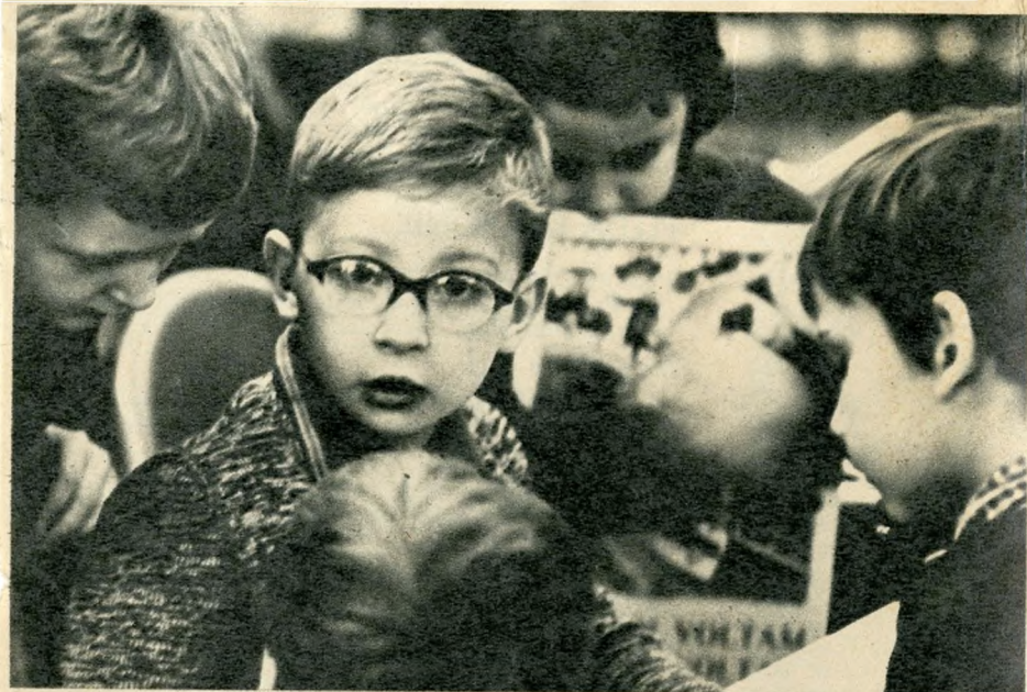
— A mókus megkérdezte az erdei forrást...

— Tessék csak nézni! Ez is „Y”, és én megismertem! Tudom is olvasni. Én! A mesekönyvből minden „Y”-t elolvasok, pedig még csak most fogjuk tanulni. Tessék csak hallgatni! Folyékonyan is tudom, nemcsak szótagolva!