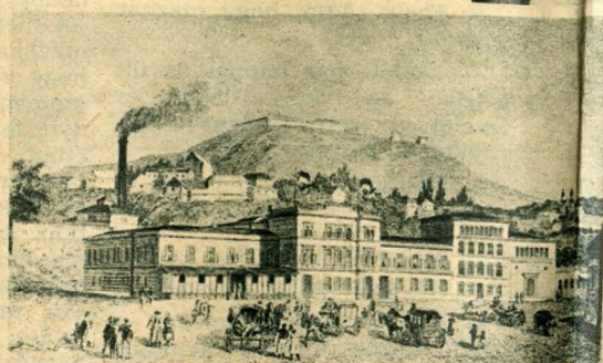
A Rác fürdő fölött 1860-ban már a Citadella magaslik