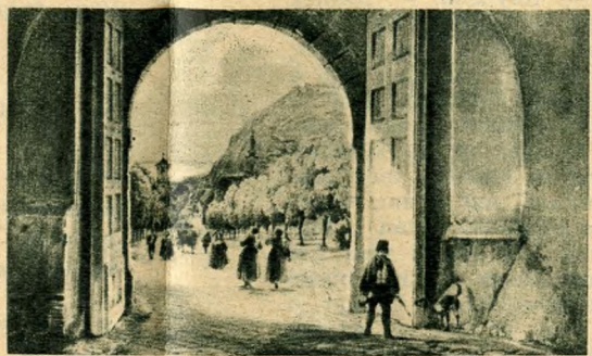
Kilátás a Várkapuból a Gellérthegyre (1845)