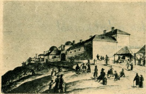
A gellérthegy csillagvizsgáló az 1830-as években