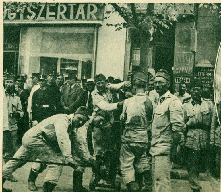
„Csörlő”-vel szedik szét a hatalmas törmelékeket.