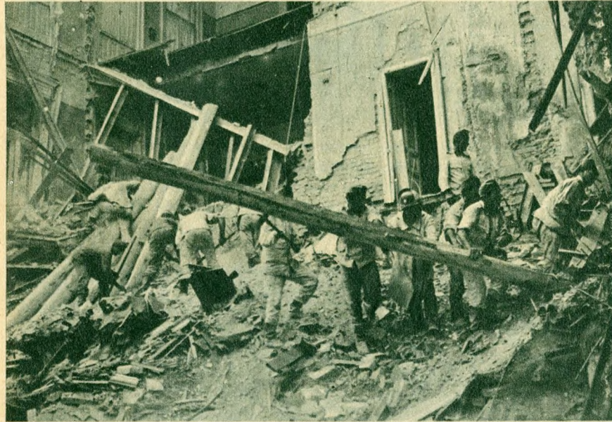
Katonák és tűzoltók együttes munkája.