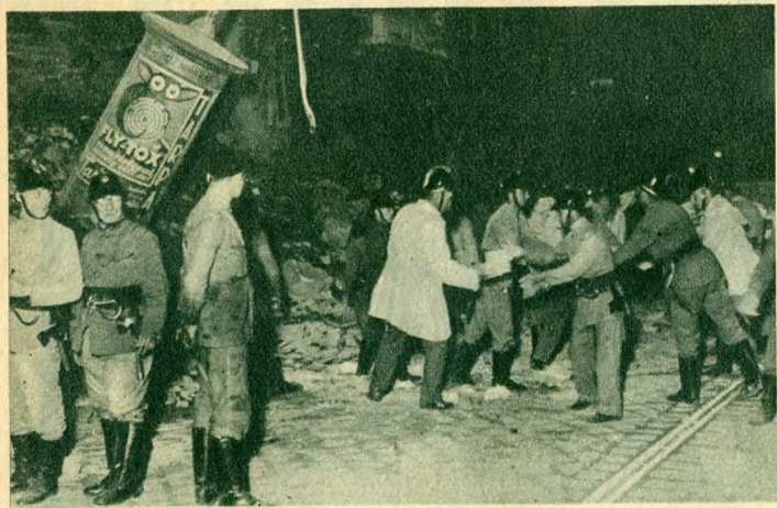
A tűzoltók éjszakai munkája.