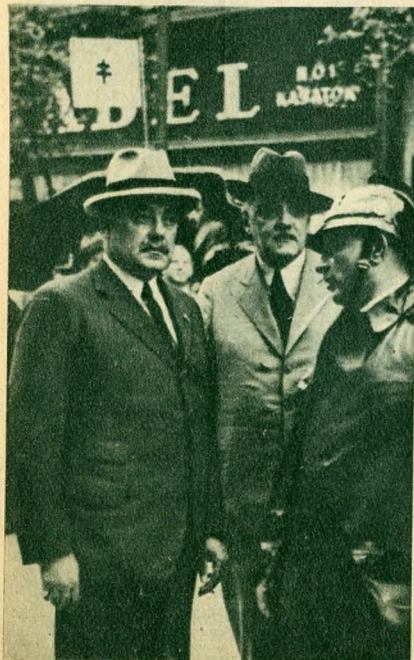
Kozma Miklós belügyminiszter a szerencsétlenség színhelyén.