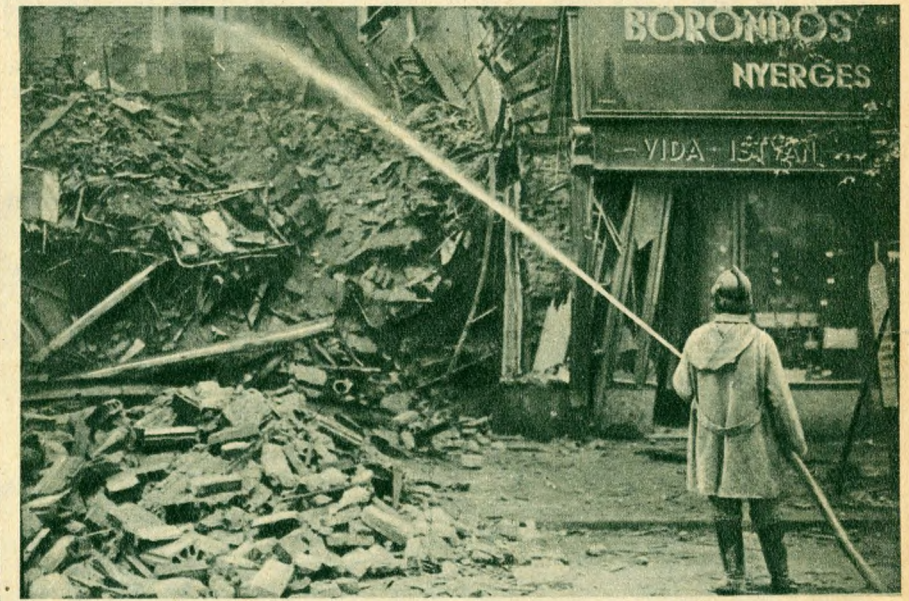
dolgoztak egész éjszaka.