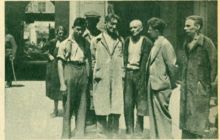
A házban levő bőröndös kimentett munkásai.