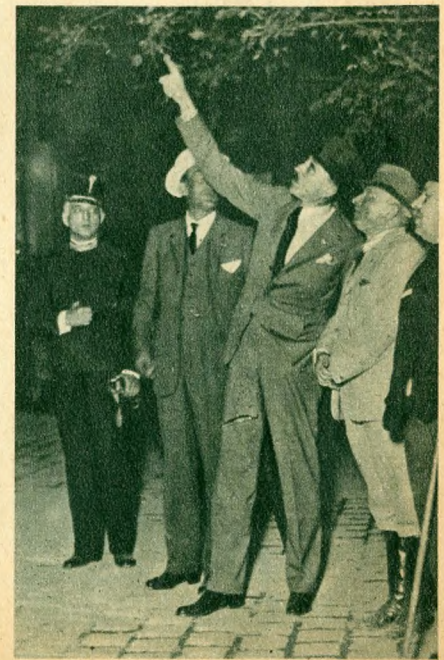
Winckler István miniszter nézi az éjszakai mentési munkálatokat.