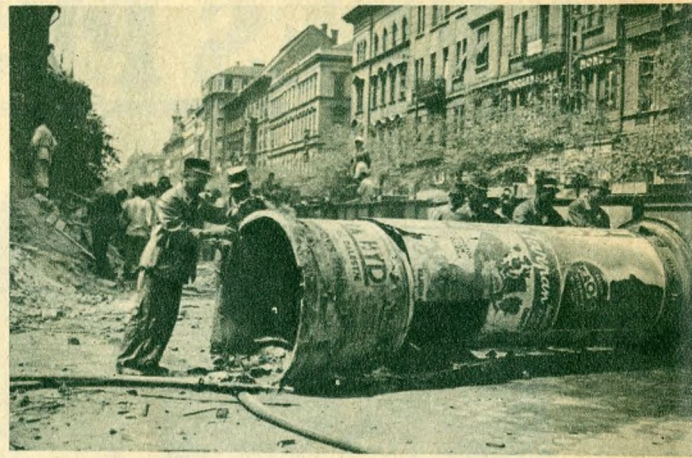
Elszállítják a kidőlt hirdetőoszlopot.