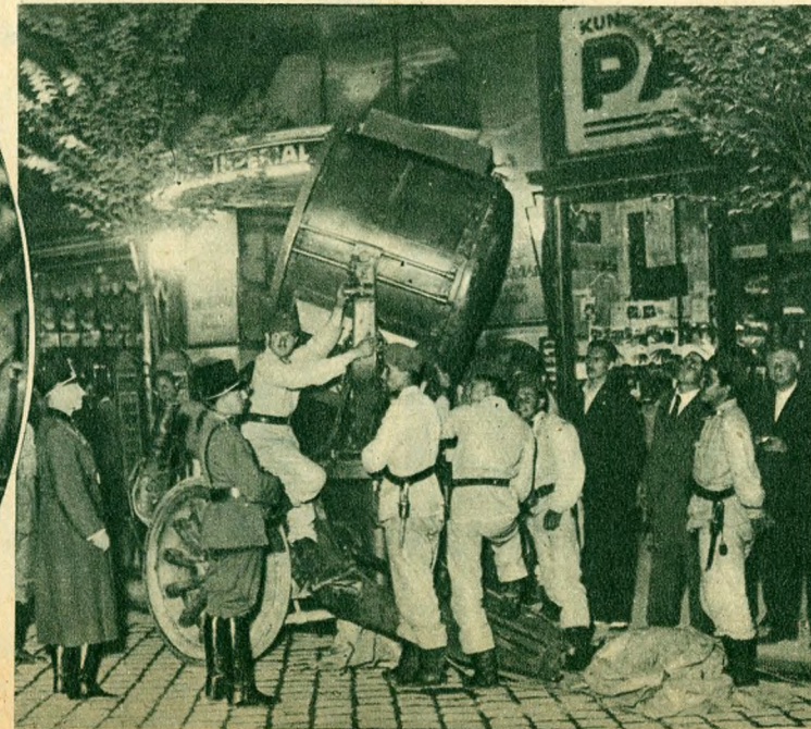
A katonaság fényszórót irányít a beomlott házra.