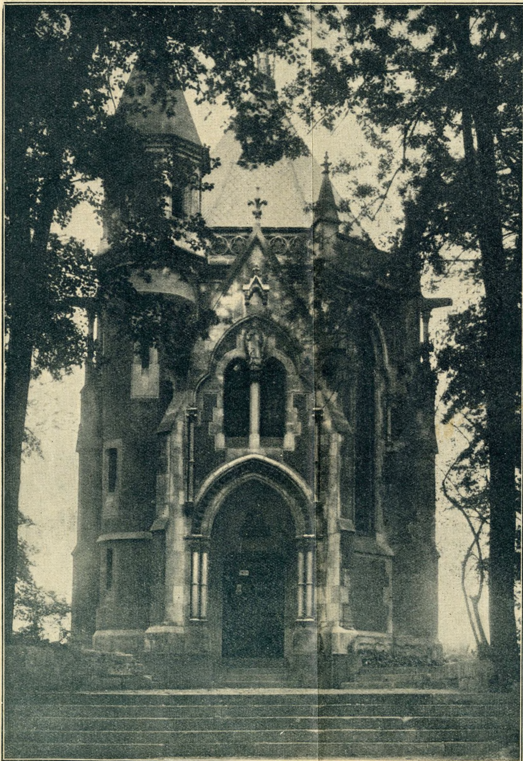
Arpád-házi Szent Margit tiszteletére emelt festői szobor-kápolna a Szent-Margitszigeten. A kápolnát I.