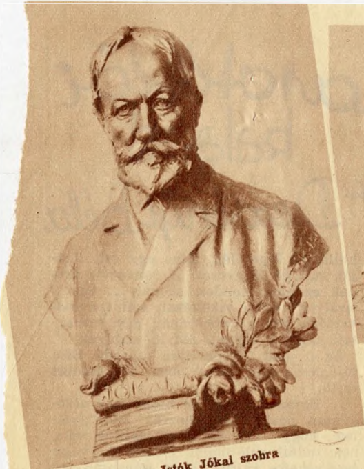
Istók Jókai szobra

idegenkedve mondták mind a hárman, hogy: valaki vagy dolgozik, vagy fényképezeti magát.