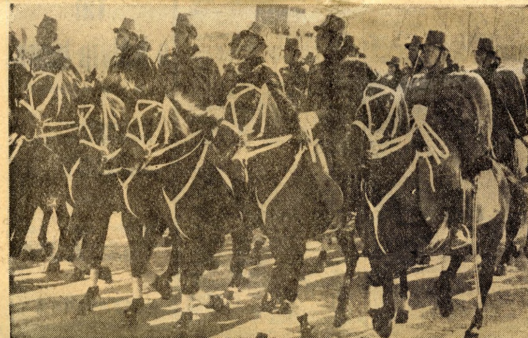
Táncoló lovak, kackiás menték — hatalmas taps, Jönnek a huszárok