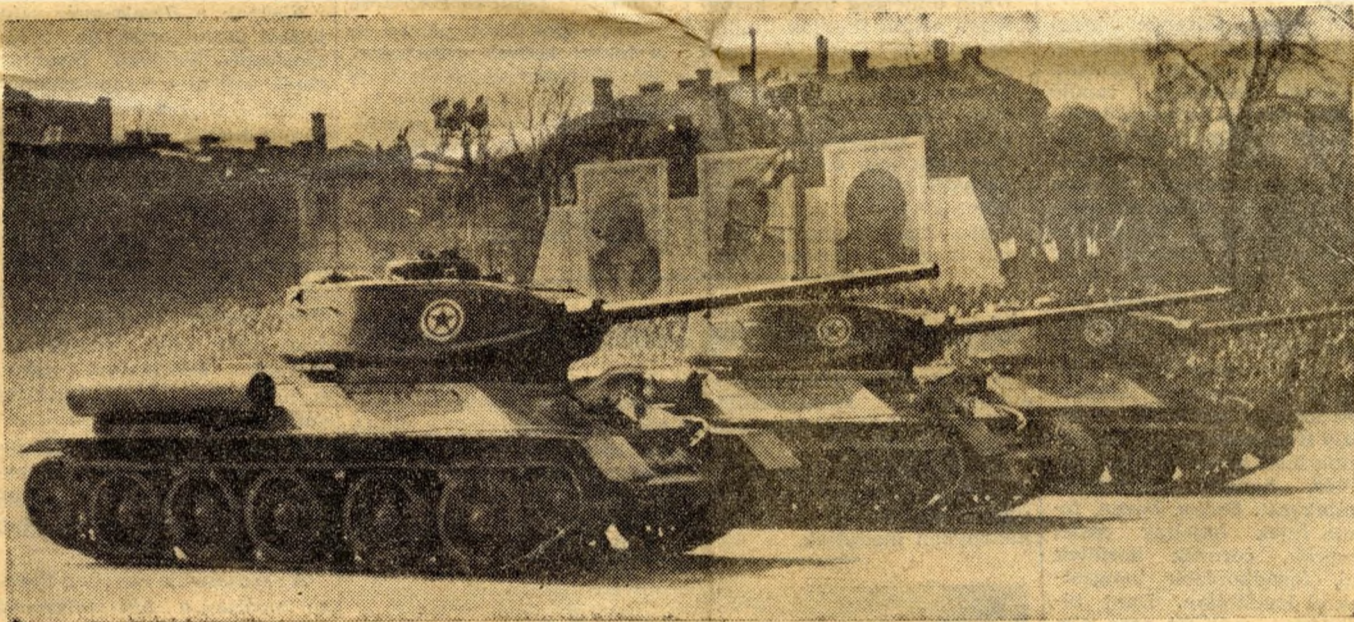
Harcokocsik alatt dübörög a föld