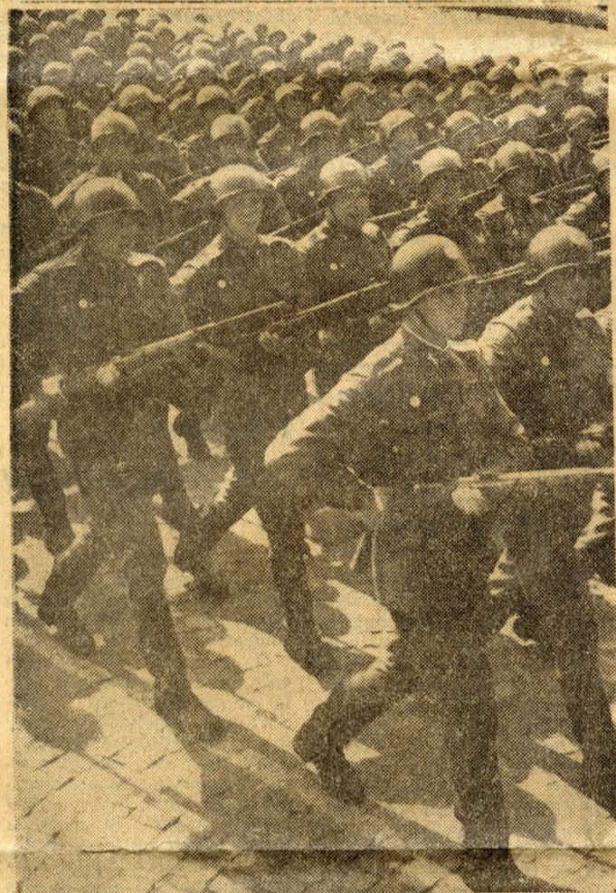
Szuronyt szegezve, dübörgő léptekkel menefel a lövésze-egység. Nehéz gyakorlatukat méltán dicsérik a nézők