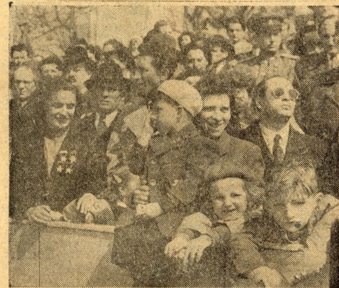
Jaj, de szép...! A nézők örömmel figyelik az elvonuló harcosok minden mozdulatát