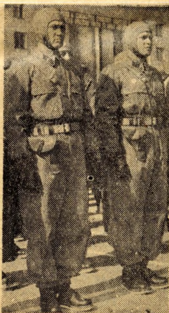
Bátor ejtőernyőseink a földön is „otthon voltak”...