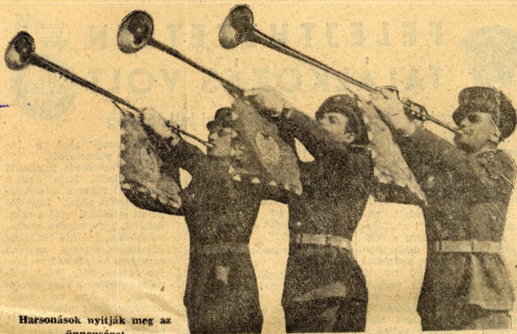
Harsonások nyitják meg az ünnepséget