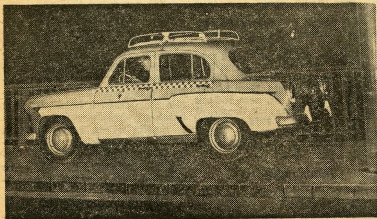
Ritka pillanat a Margit-hídon: taxi a gyalogjárón.

Reggel ébred a város, indul a közlekedés.