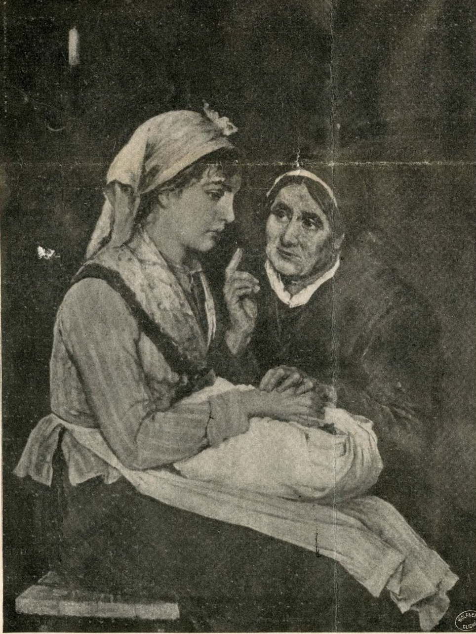
Bruck Lajos: Anyai tanácsok