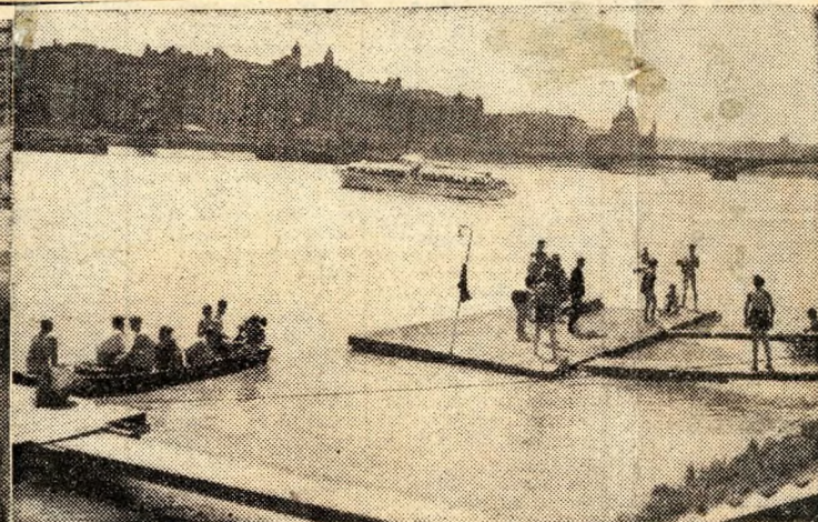
12 óra. A nap melegét már csak víz mellett lehet elviselni. Erről tanúskodnak mindazok, akik — igen sokan — a dunai csónakházak vendégeként „vészelték át” a nagy hőséget.