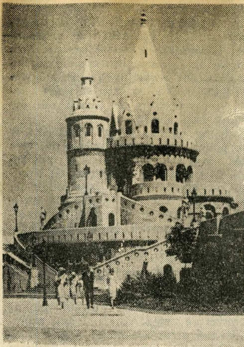
Bastion rybaków w dzień.