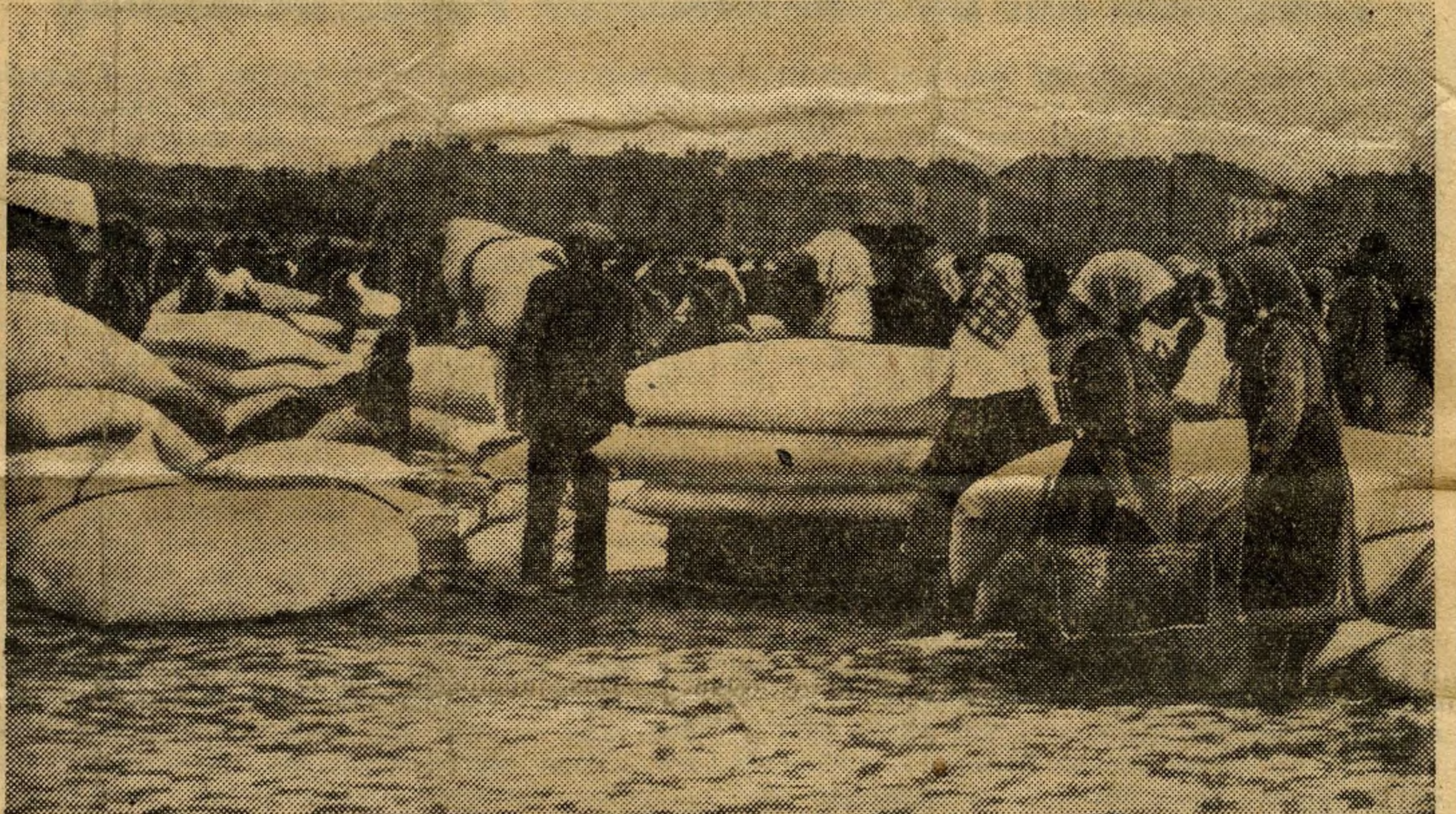
Ein Charakteristikum von Budapest, der Bettenmarkt

Unter den sonstigen erhöhten Ausgabenposten spielen die Personalaufwendungen eine besondere Rolle. Für sozialpolitische Aufgaben sind statt 19,5 im Jahre 1943 25,9 Mill. vorgesehen. Für außerordentliche Ausgaben stehen 24,5 Mill., um 8,2 Mill. mehr als im Vorjahr, zur Verfü-