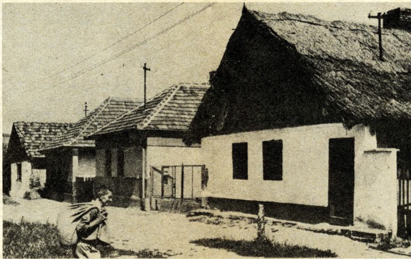
REGI UTCA A PEREMKERULET BEN

S hogy miért volt mégis teljesréggel indokolt az egyébként szerénynek mondható jubileumi ünneplés, arra ezt az érvt találjuk ama múzeumi levélben: „...középkori eredetű településeink esetében — igen ritka kivételtől eltekintve — nem tudjuk az alapítás pontos idejét... Eppen ezért immáron több évszázados hagyomány szerint az egyes települések első említését számítva ünnepljük a jubileumokat, ezért számít 1981 Rákospalota jubileumi évének, ezért jogosult a község 700. évfordulóját ünnepegni. Hasonló számítás alapján ünnepezték meg