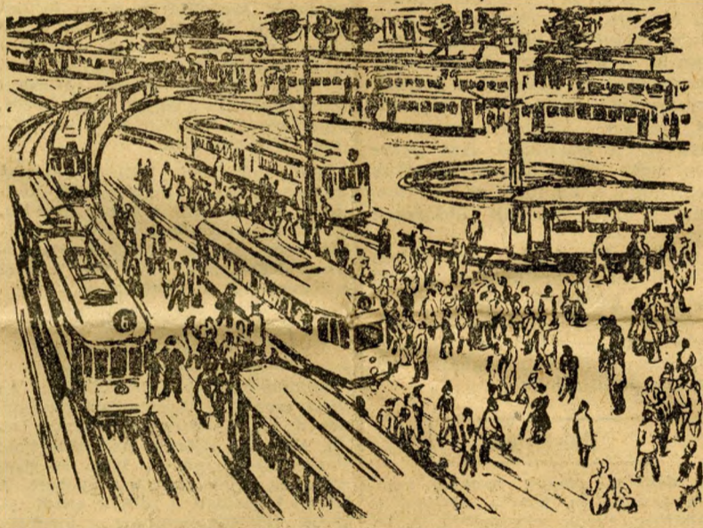
A Széll Kálmán-téri forgatagban

A VADEVEZŐSÖK csak távolról vadak. Közelről békés, pihenő dolgozók. Nagyrészt ifjúmunkások.