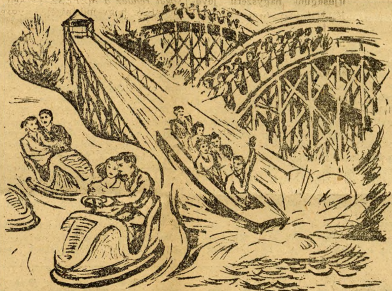
Hurrá... hurrá... hurrá...