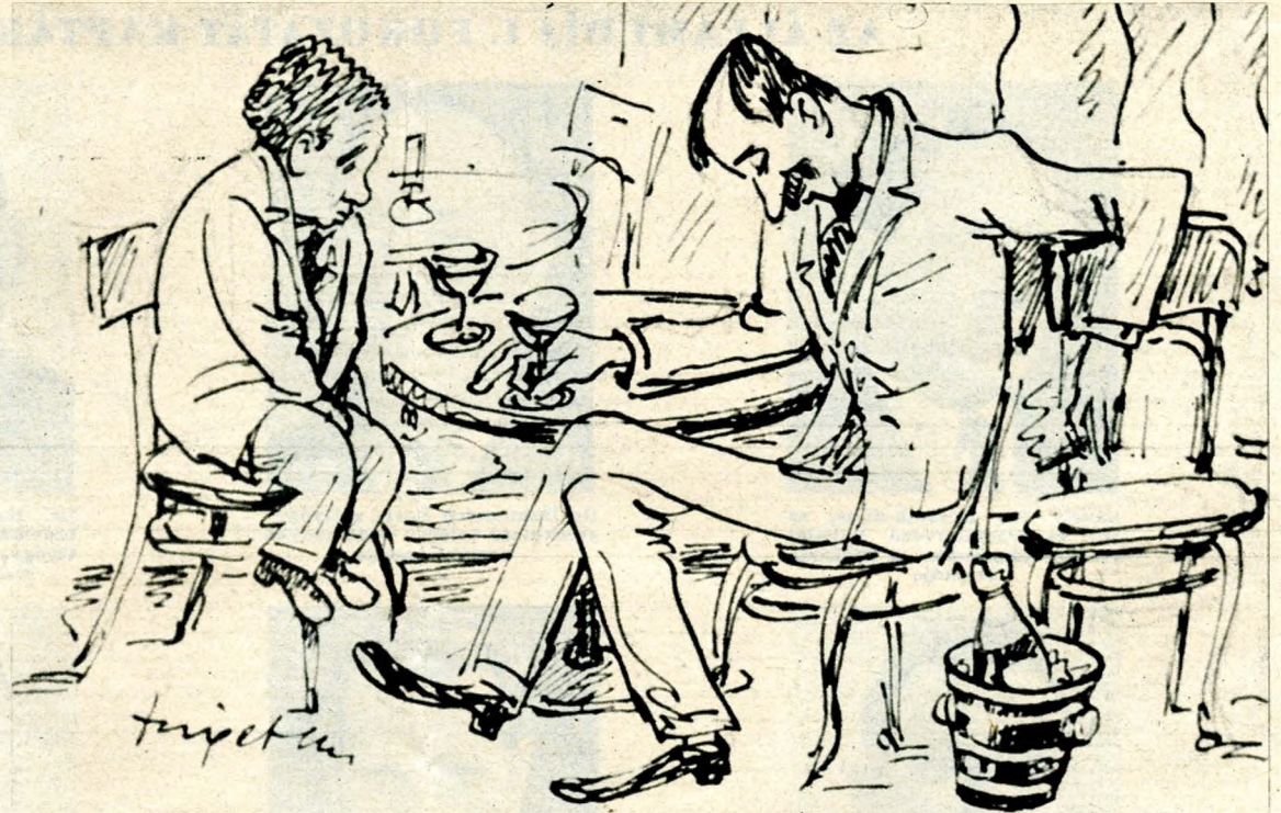
Kálmán Jenő és Krúdy Gyula