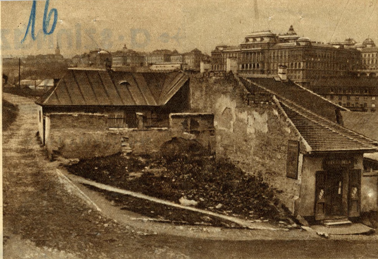
Ez az a híres tabáni romantika. Kopott, csúf viskók tűzfalai a királyi palota lábainál.