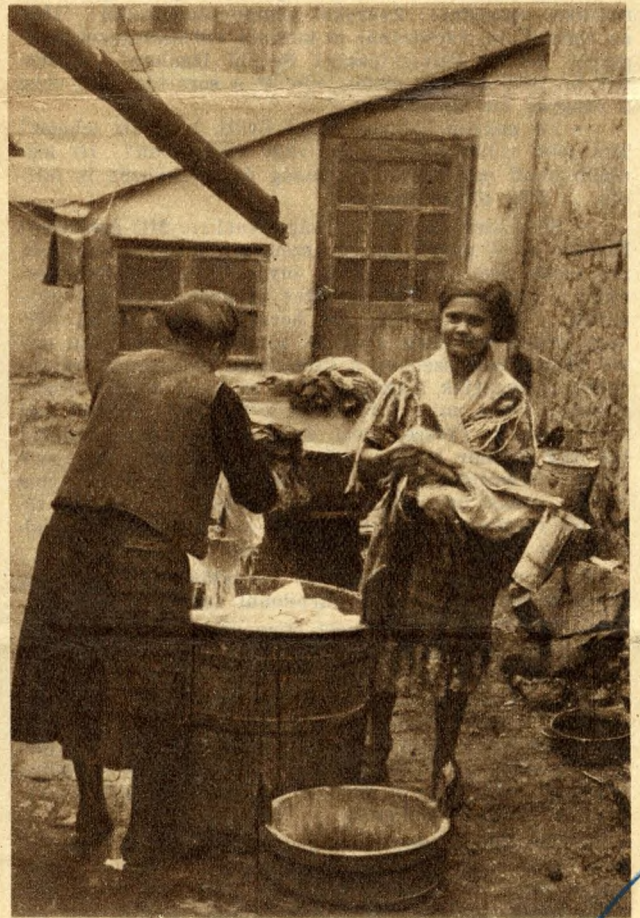
Egy hangulatos udvar és egy nemhangulatos udvar Tabánban.