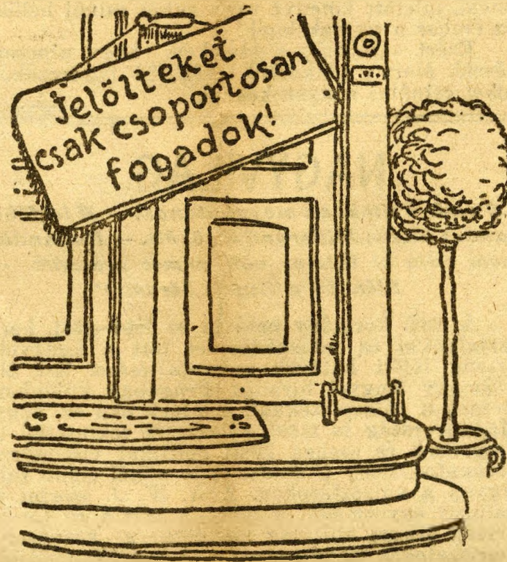
A praktikus választó.

Persze kisgazda-párti jelöltje is van a Lipótvárosnak. Előbb Hegedüs Gyulát szemelték ki erre a méltóságra, mivelhogy színművész-