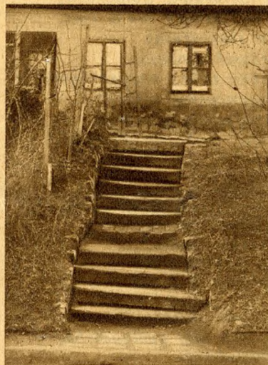
A szegénység lépcsője.

A légtisztább, legszebb, legünneplésebb az áhitat lépcsője. Oda visz a