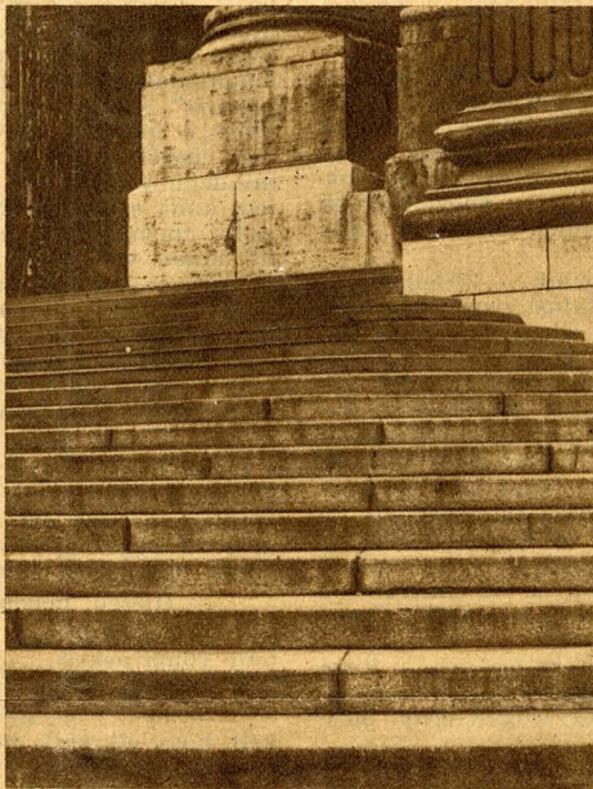
Az áhitat lépcsőfokai. A Szent István Bazilika bejárója.