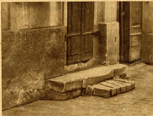
A halálraitelt lépcső, mely röviden eltűnik az utcáról, mert forgalmi akadály.