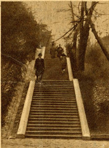
Az elegancia lépcsőfokai.

Kezdetül fogva van, mint a kerék vagy a bot. Talán a természet játékos szeszélye alkotta és tanította arra a gyermekkorát élő emberiséget, hogy milyen hasznos. Talán maga az ember jutott a felfedezésre és örömmel telt csodával mesélte, hogy feltalálta a — lépcsőt, és a lépcső épügy, mint az ember bármily más felfedezése vagy találmánya fejlődött, erősödött, tökéletesedett, tükös és szentként tisztelt hegyek oldalba vágódott, eljutott az inkák kőpalotái elé, az egyiptomi piramisok ó-felhőkarcolóira, később a ház belsejébe vándorolt, szóval megfutotta kar-