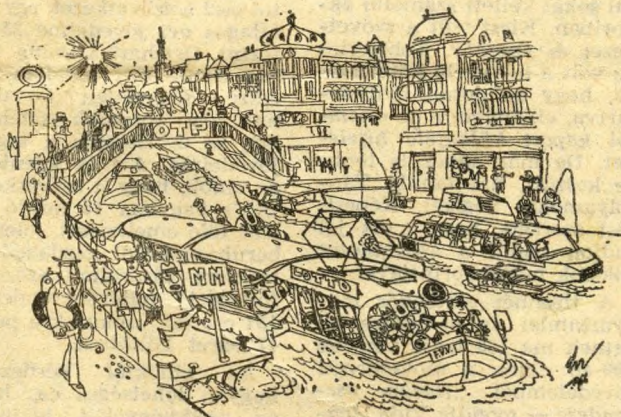
Ha elkészült volna...