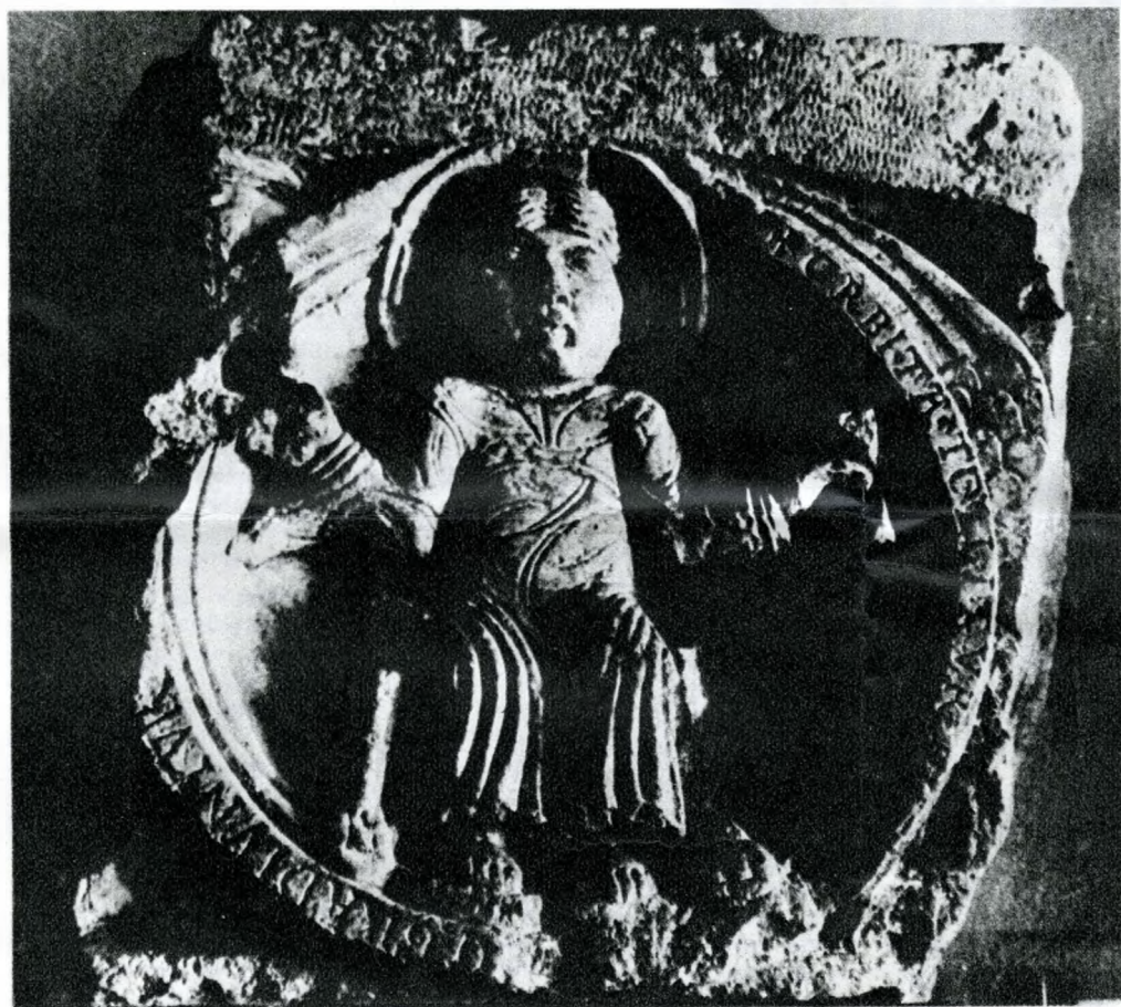
A tabáni Krisztus.

rómaiak Duna-vonalának, a Limesnek rombadőlt őrtornyai, hídfők és táborok gazzal felvert omladékai. A pesti római kori castrum a belvárosi templom helyén állt. Átellenében, a Rudas fürdő körül, feljebb, a tabáni templom körül, a Lánchídnál, a Batthyány térnél, a Bem térnél, s másfél kilométerenként fel Aquincumig, mindegyik őrtony-maradványok voltak. Állt egy a bal parton az akadémia mai székháza körül, egy az Országház helyén is. A budai Fő utca körül pedig még a gyom alól is kikandikált a római országút kövezete.