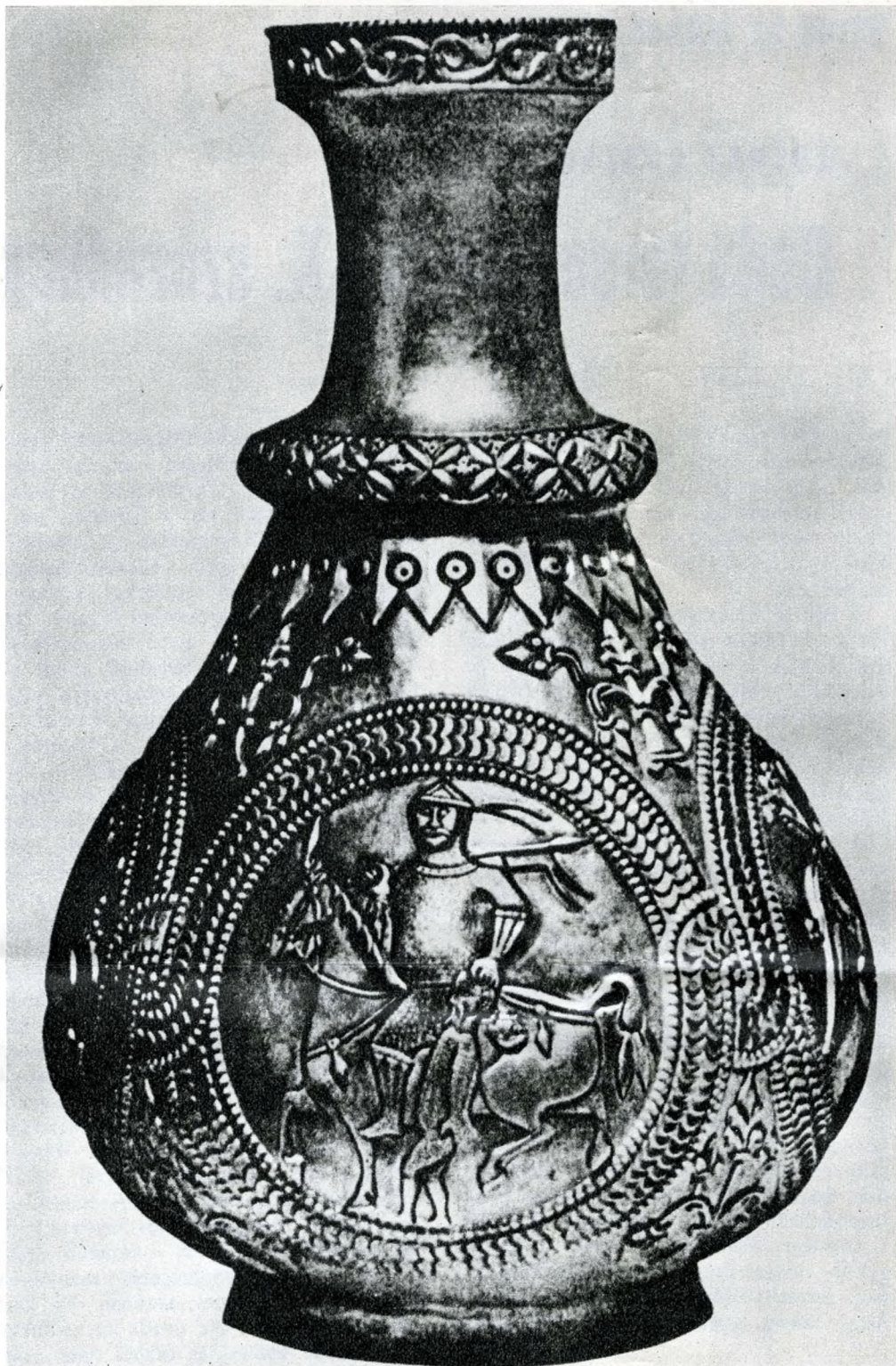
Hadifogyót vonszoló lovas. (Nagyszentmiklósi aranykincs lelet)

meg Rákos és Csepel dús legelője . Csepel az Árpád-korban hazai lótenyésztésünk központja. 1433-ban egy francia utazó írja: Pest városában az ország legnagyobb lóvásárait tartják. Itt akár kétezer lovat is vásárolhatna az ember. Szinte egy egész hadsereget lóra lehetne ültetni egyetlen pesti állatvásár lóállományával! S a Kelet-Magyarország, az Alföld felől a nyugati piacok felé hajtott szarvasmarha-gulyáknak is pest-budai révek (az Erzsébet-híd helyén a pesti rév, a Margit-híd helyén a Jenő és Felhévíz közötti rév) az átkelő helyei. Így azután az iker főváros lakói még nehéz időkben is könnyen hozzájutnak a végtelen gulyák négy lábán járó éléskamrájához. (A XV—XVI. századra németországi szarvasmarha-exportunk eléri az évi 70—80 000 darabot. Ugyanennyi fogyhatott idehaza is!)