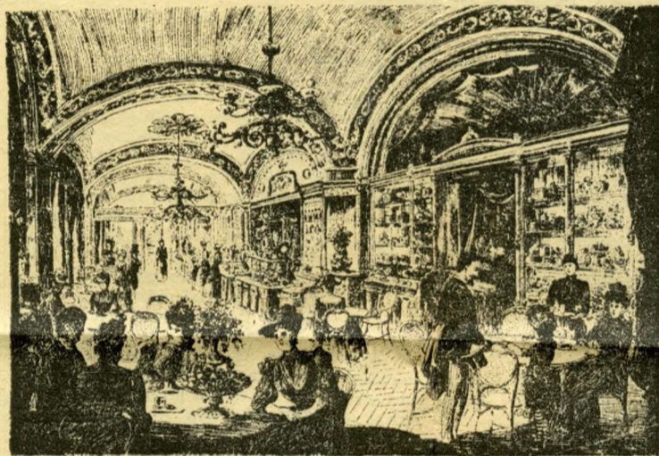
A mai Vörösmarty cukrászda, a korábbi Gerbeaud öse: a híres Kugler, a századforduló táján.

sze 1902-ben a Gundel János-féle István főherceg Szállóban a világ szállodásainak és vendéglőseinek első kongresszusa.