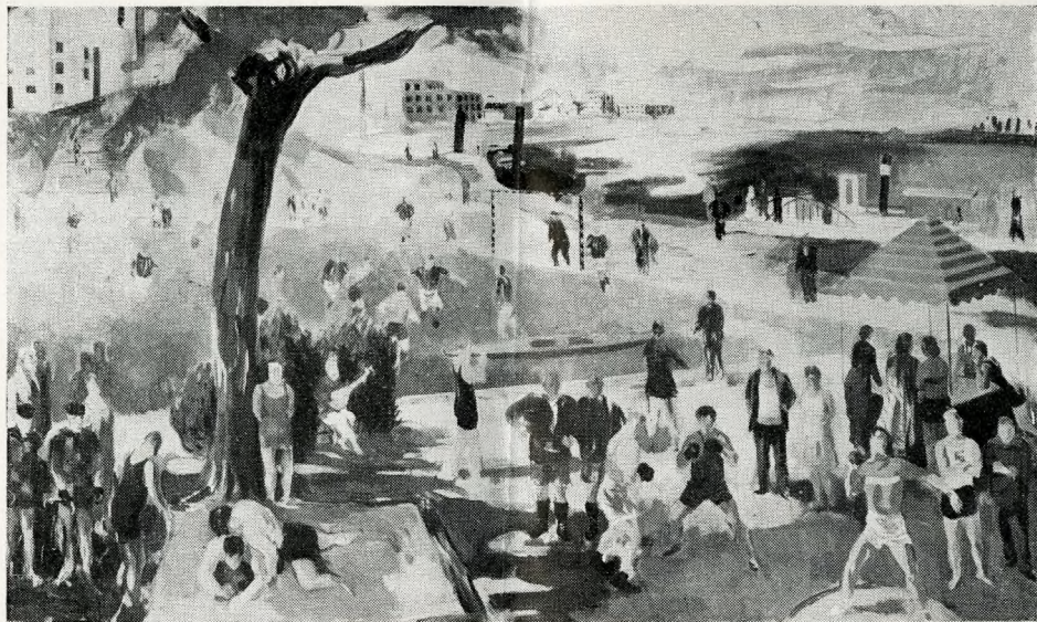
BERNÁTH AURÉL freskóterve

Francesca alakjain valami, az egész képre jellemző egységes hangulat nyilvánul meg. Egy bizonyos mérték jellemzi az alakok magatartását még Signorellinél is, aki témájánál fogva az Utolsó ítéletet ábrázoló orvietói freskóin a legnagyobb kontrasztokra kényszerült. Bár a művész feladata, hogy az egyes figura mondanivalója zárt és félreérthetetlen legyen, mégis, nem lehet elvitatni a freskótól azt a sajátságot, hogy sok rokon figura lényegében hasonló szerepeltetésével dolgozzék, épp a szemléletesség és a monumentalitás érdekében.