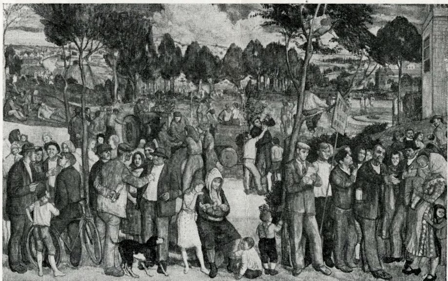
BENCZE LÁSZLÓ freskóterve