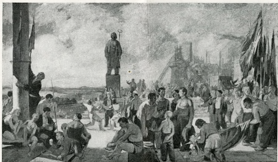
KONECSNI GYÖRGY freskóterve