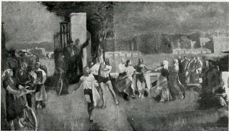
RÁKOSI ZOLTÁN freskóterve