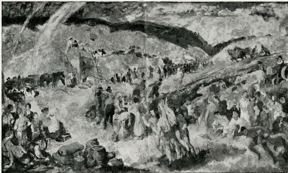
SZŐNYI ISTVÁN: A Földalatti Gyorsvasút Népstadion állomás-épületébe készülő freskóterve