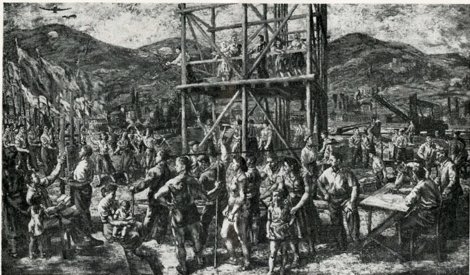
BÁN BÉLA freskóterve