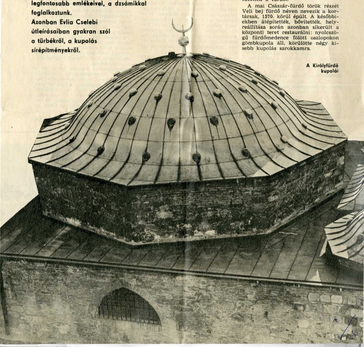
A Királyfürdő kupolái

A mai Császár-fürdő török részét Veli bej fürdő néven nevezik a kortársak, 1570. körül épült. A későbbiekben átépítették, bővítették, helyreállítása során azonban sikerült a központi teret restaurálni: nyolcszögű fürdőmedence fölött oszlopokon gömbkupola áll, körülötte négy kisebb kupolás sarokkamra.