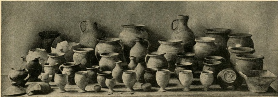
Egy veremgödör válogatott anyaga