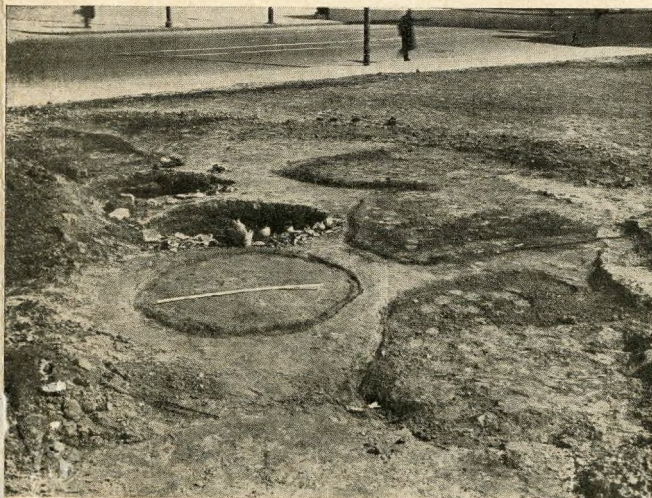
Lakógödörök sötét nyomai az ásátás előtt

Középkori hídfőnktől sétáljunk a tabáni szeb templom irányába, a rommaradványok sűrűjébe. Csonkán meredő falak közt találjuk magunkat. Mintha pusztító légitámadás döntötte volna romba ezt a városrészt. A falakba vágott, felül félköríves boltosított ajtók betekintést engednek a titokzatos rendeltetésű építmények belsejébe. A kapuk mögött alagút-üreg sötétlik. Ezzel már el is szóltuk magunkat, mert az ásátás vezetői szerint ezeknek az épületeknek a rendeltetése valóban regényes és bizonytalan, a kapuk mögötti üregek valóban alagutak torkolatai. A Várhegy felől jövő alagutak (amelyek nyilván a Szent Imre-fürdő irányába a királyi fürdőbe, illetőleg a Duna felé haladnak) biztonságát védő tornyok maradványai bizonyára ezek a négy-