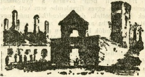
A lipótvárosi templom romjai

Egyszerre tűzkialtás futott végig a városban. A vármegyeházára szórt tüzgolyók felgyújtották az urivetci Trattner-Károlyi-házat. S a pokoli lármát csak fokozta a villámgyorsan