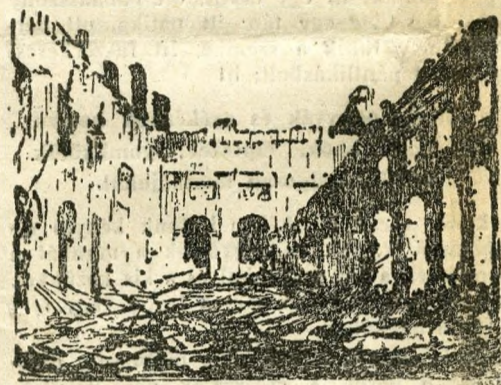
A Vigadó nagyterme, ahol üléseit tartotta a nemzetgyűlés

Május negyediken délelőtt tíz óra volt, mikor az emberek a budai oldalról két lövést hallottak . Némelyek ugyan a partra siettek, de minthogy a lövések nem folytatták, a város nyugodt maradt. Délben a dolog kezdett komolyabbá válni. Egyik lövést a