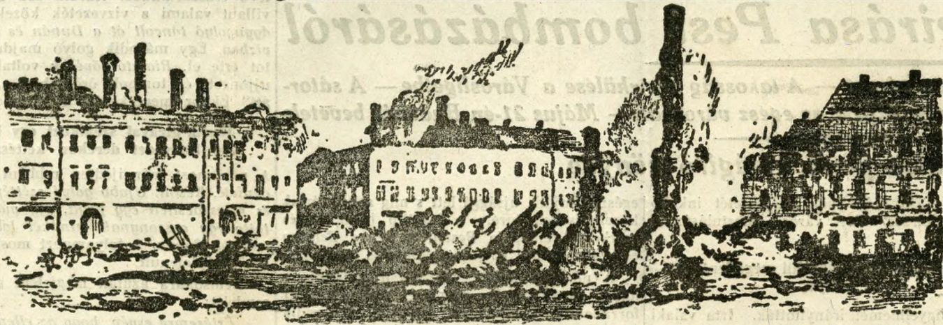
Az ideiglenes német színház pusztulása a mostani Erzsébet-téren

szedelőzködés, élénk sürgés-forgás támadt, a boltokat bezárták, s mindez megrendíthette a lelket a legbátrabb emberben is. De még sötétebbé tette a közhangulatot az a látvány, hogy az emberek összecsomagolják értékeiből holmijukat, ágyneműt, butort visznek el hazulról, ami világos jele volt annak, hogy meglehetősen letettek arról a reményről, hogy hamarosan jobbrafordul a helyzet. Az a szárnyra kelt hír, hogy amennyiben az ostrommal dacoló vár ellen komoly támadás indulna meg, a pesti oldalról is részt venne az ostromban néhány üteg s a budai magaslatokon elhelyezett ágyukkal együttműködve, megtámadná a városnak a fővárossal szemközti lővő, addig bántatlan részét, (amely híresztelésnek a valószínűség látszatát kölcsönözte az, hogy a József-téren sok homokoszsádot tartottak készenlétben s hogy a pesti kőműveseket titkos éjszakai munkára rendelték ki), csak még jobban igazolta és fokozta az aggódo feszültséget és rettegést. De a főváros dicséretére meg kell említeni, hogy