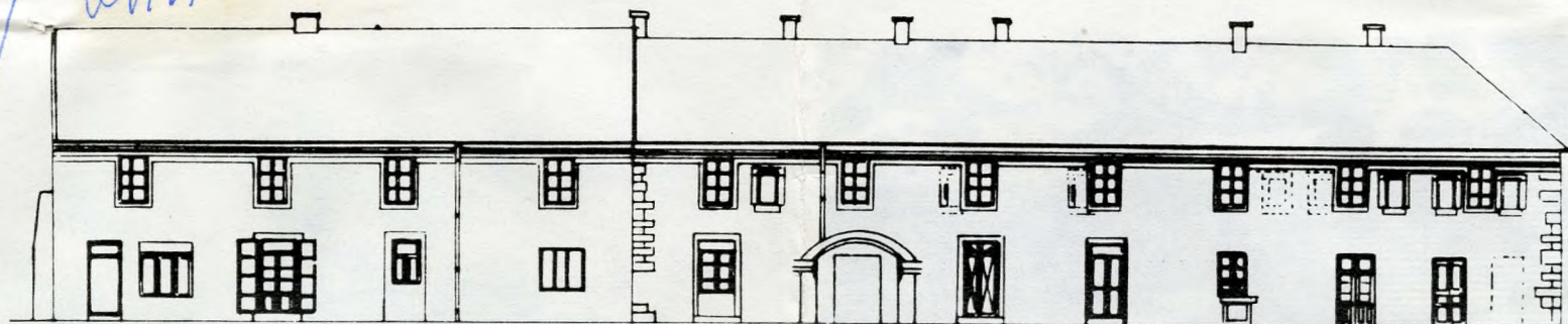
A Lajos utca 158. homlokzata a kibontott középkori ablakokkal. Sodor Alajos rajza.