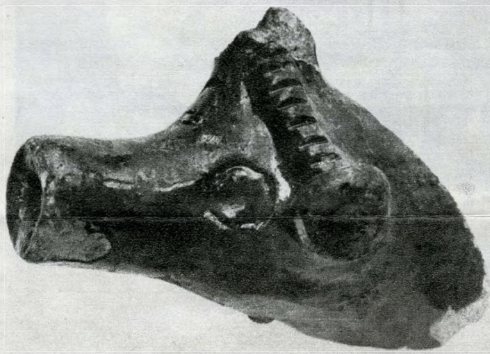
XIII. századi ausztriai állatalakos kiöntőcsöves edénytöredék

középkori nyomok a 60-as években. A Budapesti Műemlékjegyzék (1960) és Budapest Műemlékei 2. kötete (1962) a lakóházakat tévesen a 14. században épült klarissza kolostor részleteként írja le. A klarissza kolostor feltárása után több 13–16. századi házat és több utca maradványait találtak meg a középkori eredetű Lajos utca 158. körül. A házak egy kiöblösödő utcából alakult középkori tér mentén sorakoztak a 18. századi állapothoz hasonlóan. Ehhez csatlakozott egy feltételezett észak–déli utcának dél felé kiöblösödő része (a mai Lajos utca 160. környéke). A piactér a 11–12. századi, északkelet–dél-nyugati útra épült, melynek egyes rétegein 12., illetve 13. századi és késő középkori anyag került elő. Feltételezés szerint, ez az út ke-