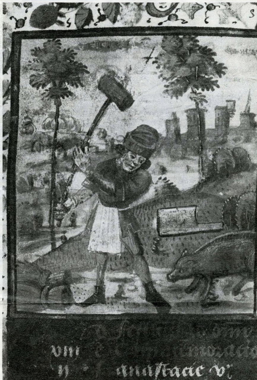
Disznóölés ábrázolása a XVI. században készült kalendáriumból