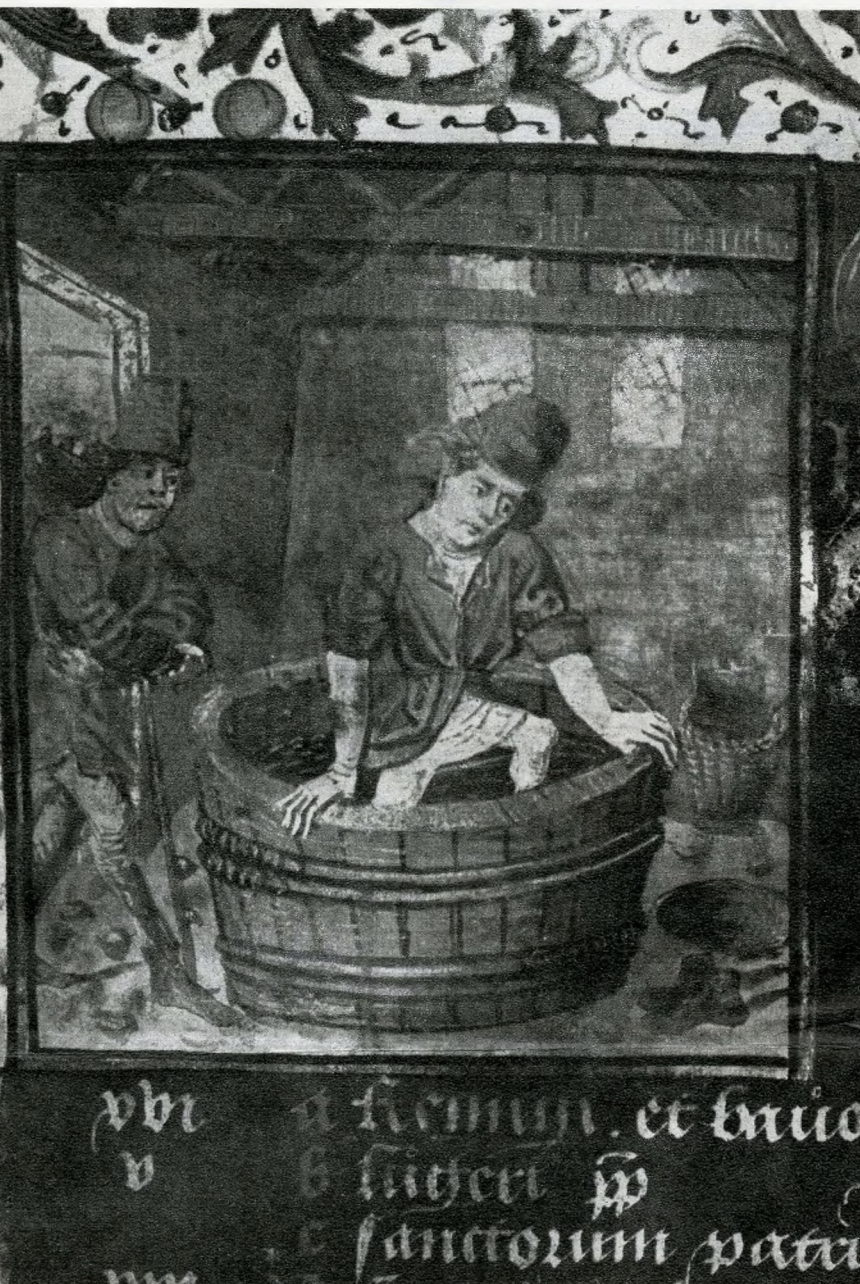
Szőlőtaposás. XVI. századi kalendáriumrészlet.