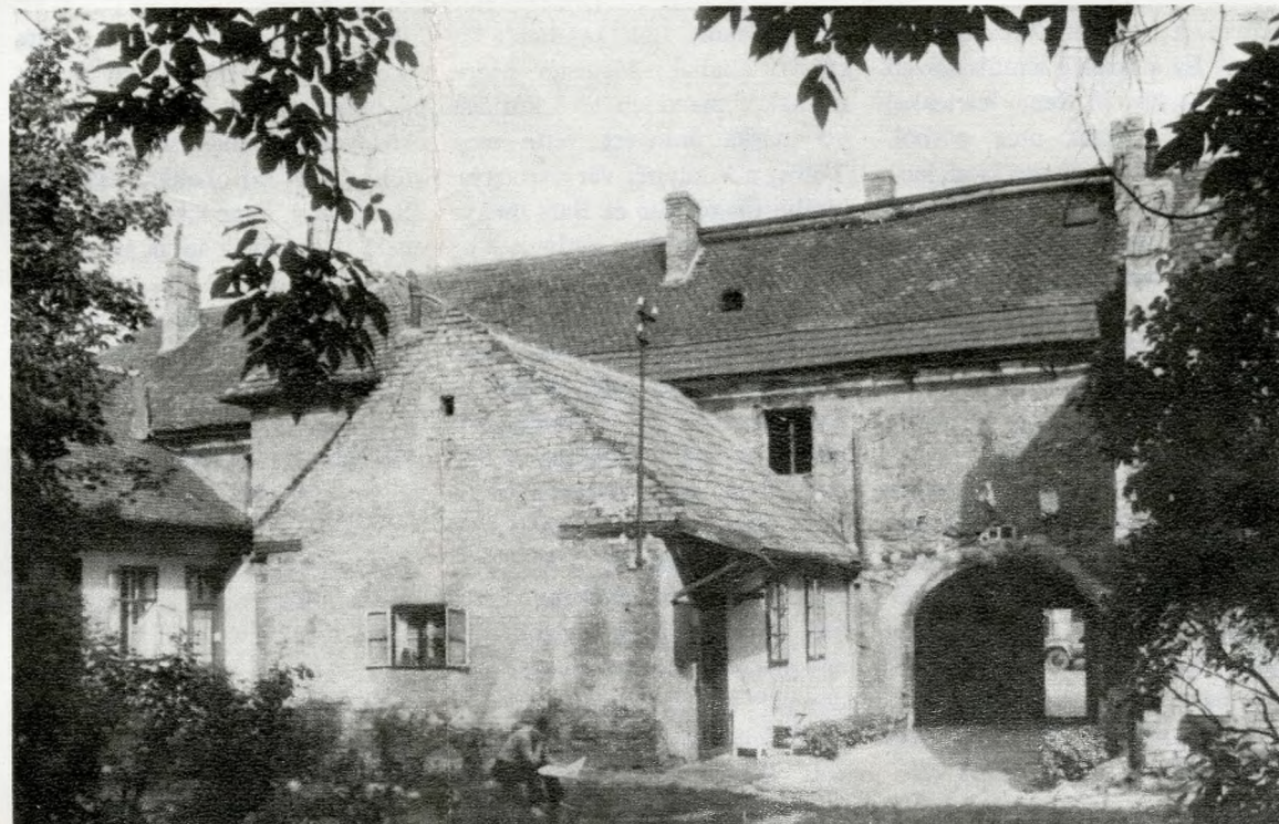
A Lajos utca 158. udvarrészlete a középkori épülethez csatlakozó toldalékszárnyakkal

hajókat vámolták meg az óbudai kikötőben. Valószínűleg ezekkel az árukkal kereskedtek azok a kereskedők, akikről az oklevelekből és az ásatásoknál előkerült leletekből szerzünk tudomást. Kereskedésre, pénzváltásra mutat az a két újabb lelet is, melyet a piactér, az első királyi kúria és a prépostság környékén találtunk. A két, részlegesen megmaradt bronzmérleg készítési módja és kialakítása azonos azzal az ugyancsak Óbudán előkerült mérleggel, melyet a 12. századra datált Méry