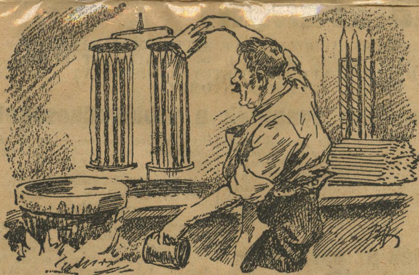
Viaszgyertya-öntés az ujlaki kétszázéves műhelyben.

Megmutatják a gyertyamártogató műhelyt, a fa-gépet, a korongokkal és az u. n. kalappal, amelyben a gyertyamasszát melegítik. A korongokról lógnak le a gyertyabeklek, amikre kis kannával öntögetik rá a viaszot, amíg összeáll a gyertya, amelyet aztán kézzel diszítgetnek.