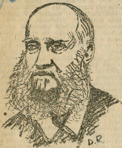
Podmaniczky Frigyes báró.

Minden nagy zaj nélkül, a külső láрма és hatásteljes reklámdob teljes mellőzésével, de annál bensőségesebben és igen meleg érzéssel ünnepli Budapest holnap a főváros egyik jelentős kulturtörténelmi eseményének, Operaházunk megnyitásának negyvenedik évfordulóját, akik akkor a színház élén voltak, akik a színpadon