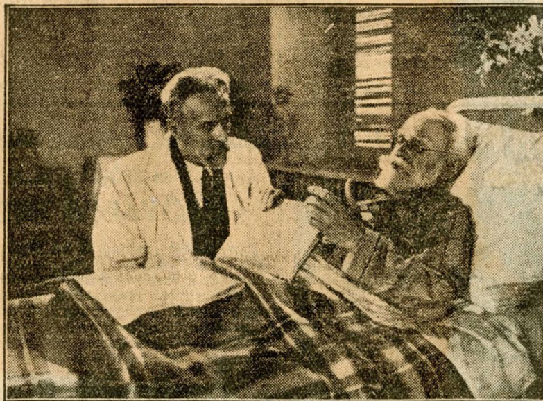
címmel, nagy sikerrel megy a Pavlov világhírű tudós és kutató életéről szóló kitűnő szovjet film a főváros moziáiban