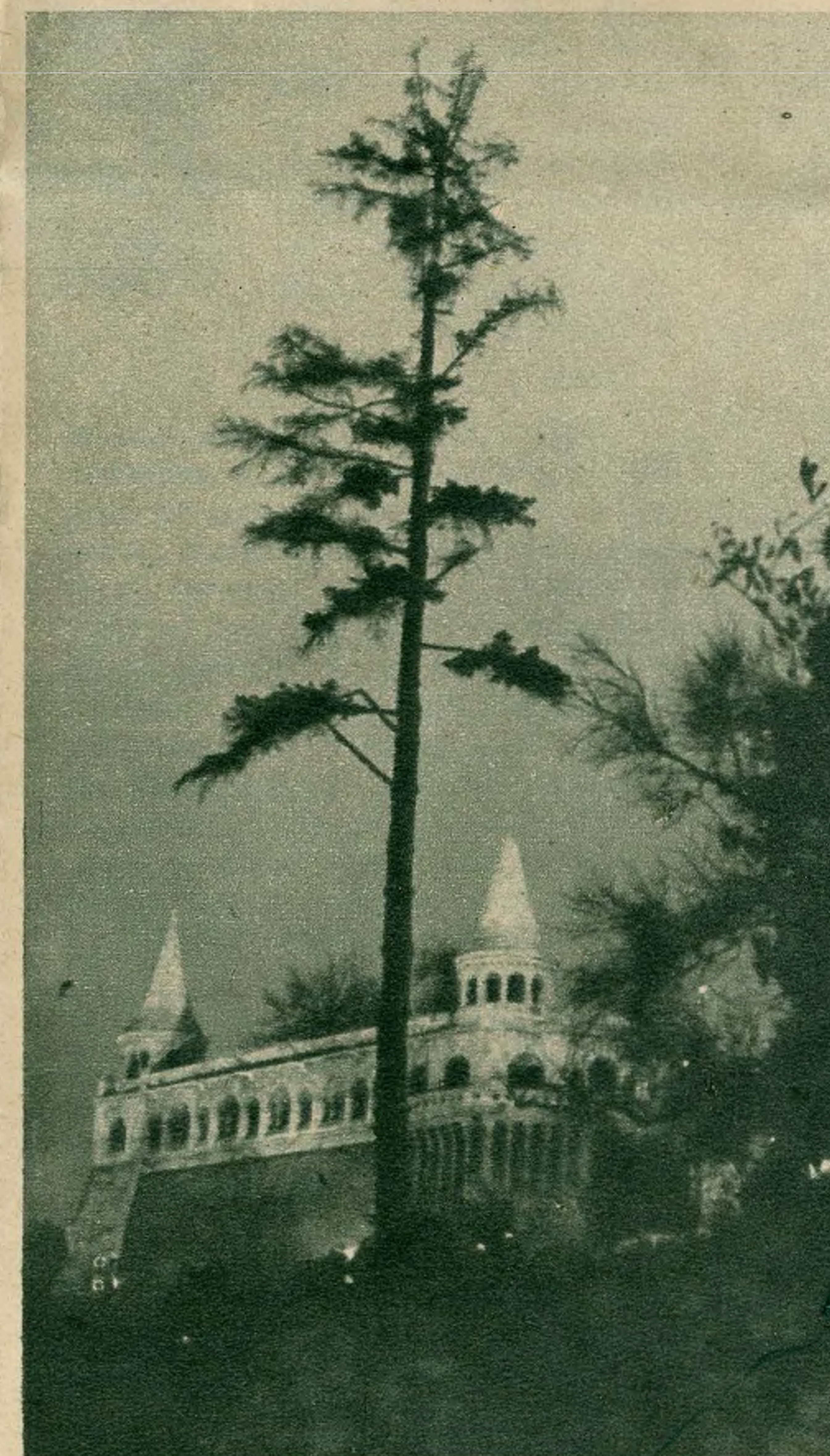
Leszállt az alkony a Halászbástyára