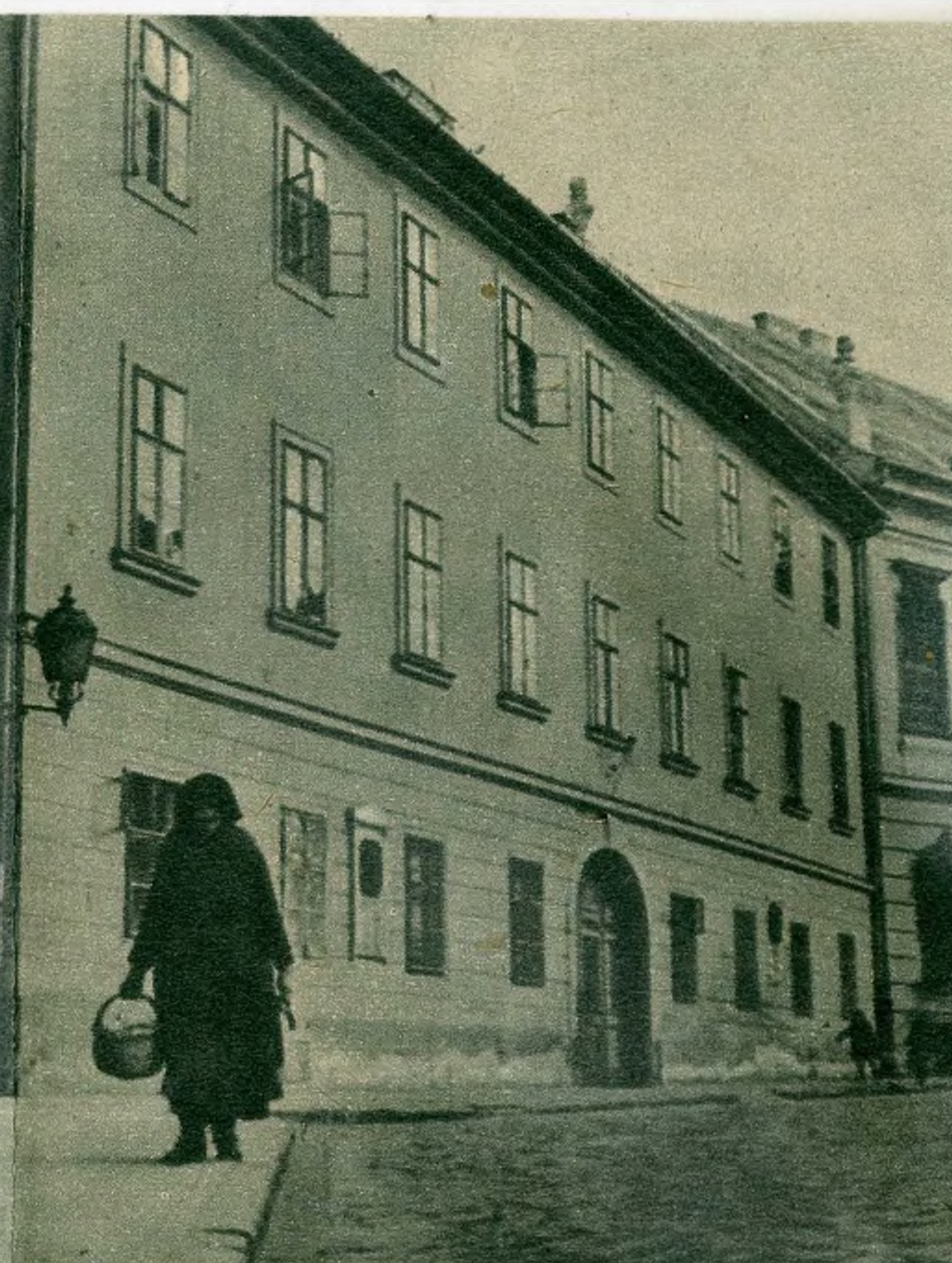
Arnyam ráhull az ódon várfalakra és elgondolkozom: „Hova tűnt el a tavalyi hó?” — ötlik eszembe a hajdani francia költő, Villon verse, de válasz helyett csak a cipőm sarka kopog a hűvös köveken.