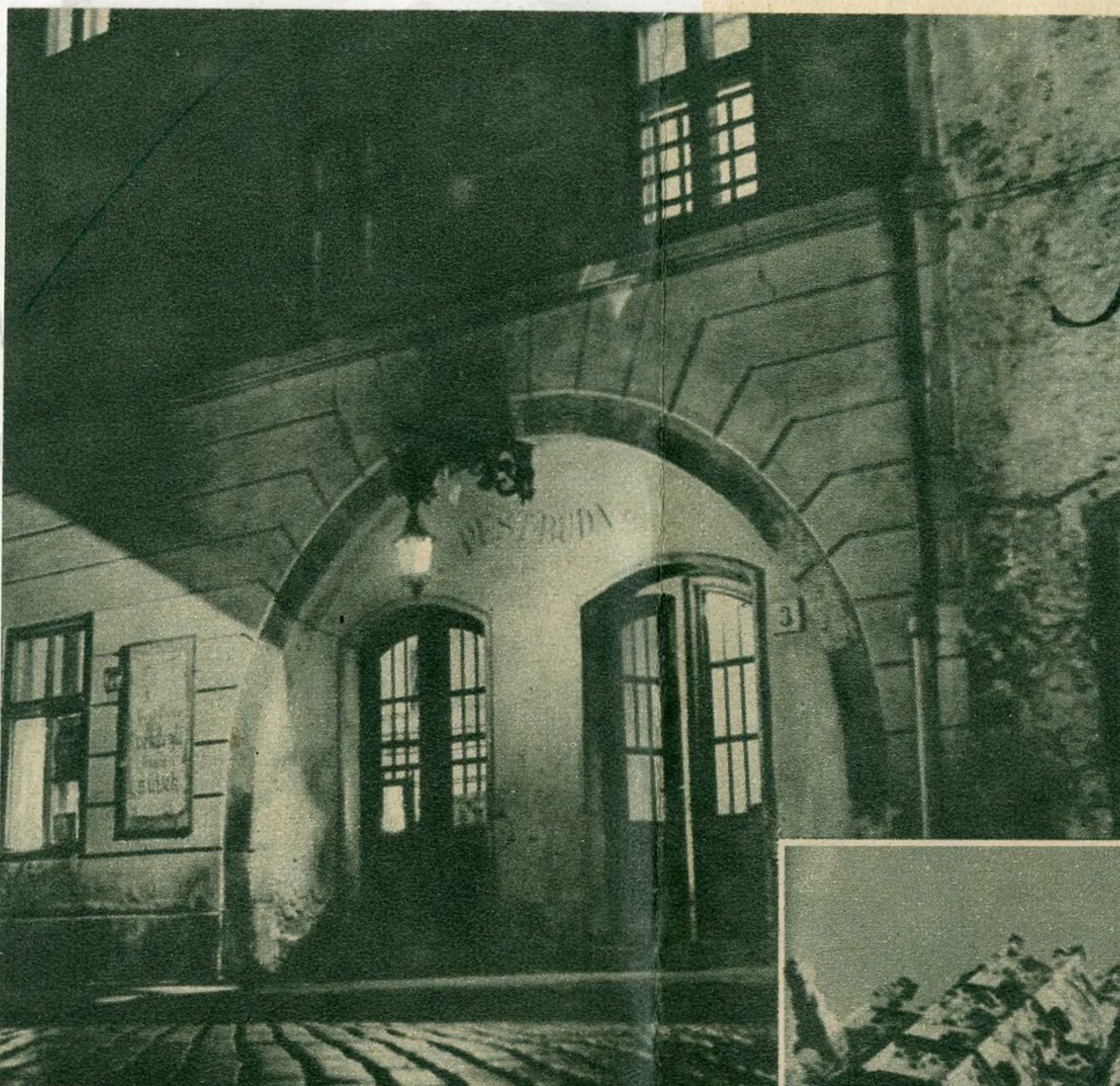
A híres Pest-Buda mulató. Hajdan szépapaínk és szépanyáink borozgattak itt. A patinás, hangulatos műlató ma is kedves szórakozóhelye a pest-budaiaknak