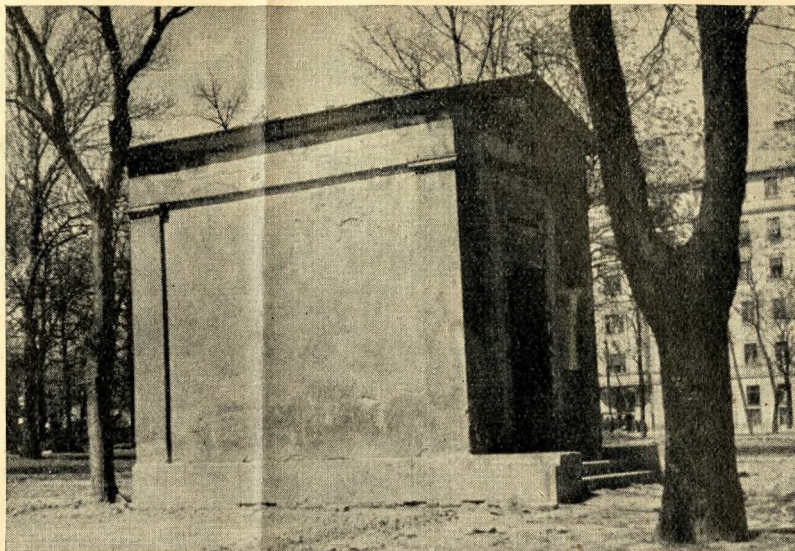
Sírkápolna a tabáni temetőben

igaz, hogy olsó kis virágok voltak, legtöbbször az a húsos, nedves levelű, apró sárgavirágú koszorú, melyet öregasszonyok árulnak földszintes házak udvarán. A temető így lett park, de park már a Gellérthegy is, ahol valaha fogócskát játszottál, a Búsuló Juhászból a cigányt hallgattad. Talán lépésben, hangfogóval siklanak itt az autók is. Nem ismered ki magad a hajdani vadon helyén. Ahol kőfejtők álltak, ma villák merengenek, lehetőleg schönbrunni sárgán és neobarokk stílusban, a keramitos udvarokon nagy fekete autókat mosnak, s nemsokára csak a kálvária mögött eregethetnél sárkányt, a spárgát odakötözve a festett, barna kerítéshez és leülhetnél szemben a lassan szétkopó Krisztussal és a latrokkal. Ahogy továbbmegy, a Lágymányos felé, a Gellért-fürdő fölött a hajdani nagy barlangot keresd, melyben nappal rejtezkedő szegénylegények tartózkodtak, éjjel pedig a babonások gellérthegyi boszorkányai. Egyszer, nagyon kicsi voltál még, bemerészkedtél a fűvel benőtt szájú