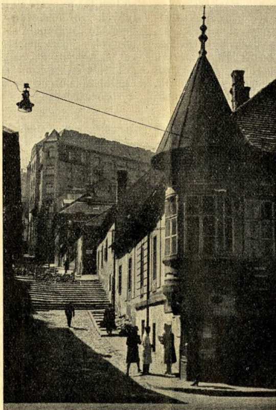
Sarokház a Fő-utcában

A halál akkor kezdődik, amikor az utcanevek eltűnnek. Emlékszel még a Szarvas-térre? Budán volt valamikor; ha hűsz elmúltál és nem vagy még harminc, már emlékezhetsz rá. Óreg, emeletes házak álltak roskatagon körülötte, az egyiknek, éppen a sarkon, magas feljárója volt, amelyről a villamosokat szinte a mélységben lehetett látni. Az út, amely belőle nyílt, földszintes házak mellett vitt el, s ezek a földszintes házak elsüppedtek a budai homokban, két-három lépcsőn kellett lemenni, hogy betérhessünk egy-egy félig összecsuklott kapun. A barna kapuk mögött macskaköves udvarok voltak, némelyik még kúttal; a hátsó traktus félemeletes volt,