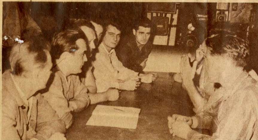
Brigádmegbeszélés kulturális vállalás ügyében