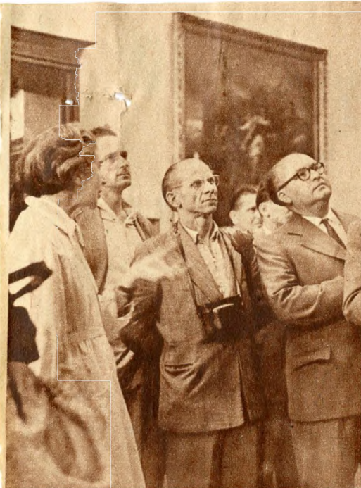
Az Egyesült Izzo dolgozói tárlatlátogatáson