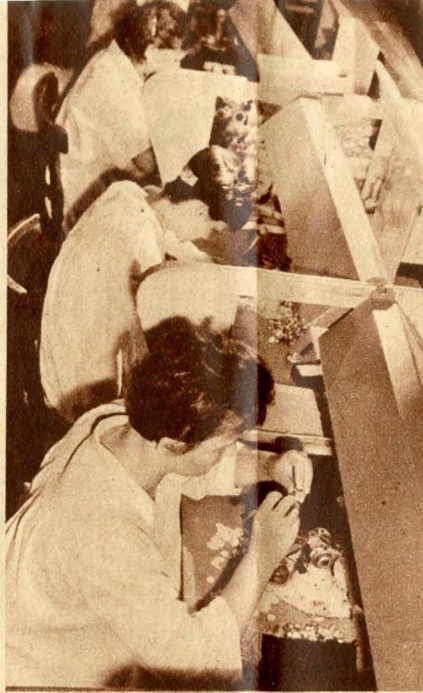
A Munkásakadémia tematikája a helyi sajátosságokra épül: túlnyomó többségben vannak a nők és a fiatalok