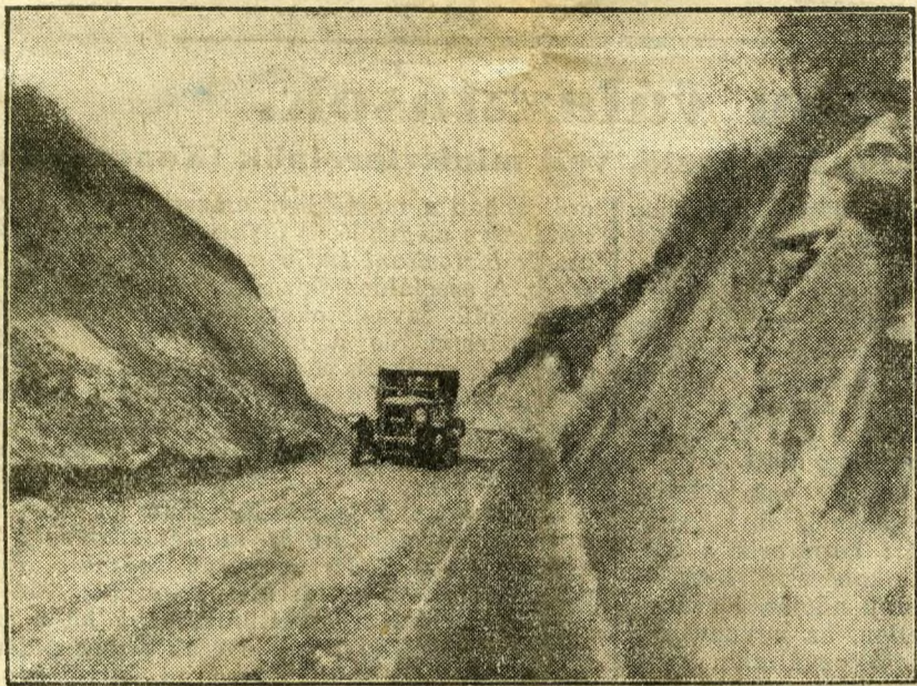
Mélyutakat vájnak a hegyvidéken a közlekedés céljaira.

hogy a törvényhozásban vagy a városi közgyűléseken olyanok képviseljék, akik elhanyagolt állapotán, visszamaradottságán céltudatos, komoly munkával segíteni akarnak. Akármiről is volt szó, Pesten, ut-, lakás-, vízvezeték-, esztornázás-, rakpartépítkezésekről, vagy hegyvidékek szabályozásáról, amelyek Pest körül vagy Buda más részein nagy területeket tettek alkalmassá arra, hogy ott emberek lakjanak, Óbuda mindig háttérbe szorult. A lakosság érdekeinek szem előtt tartása mellett pedig ezekre a közművekre parancsoló szükség lett volna. E mellett az óbudai téglagyárak rettentő és iszonyu rombolást vittek végbe, aminek legzsembeötlőbb jele az, hogy a Margit-hídtől vilámlamoson nyolcperenyire ma is hatalmas téglagyárak dolgoznak és bányásszák el a hegyet, az utat, a fejlődés lehetőségét Óbuda előtt. Hogy