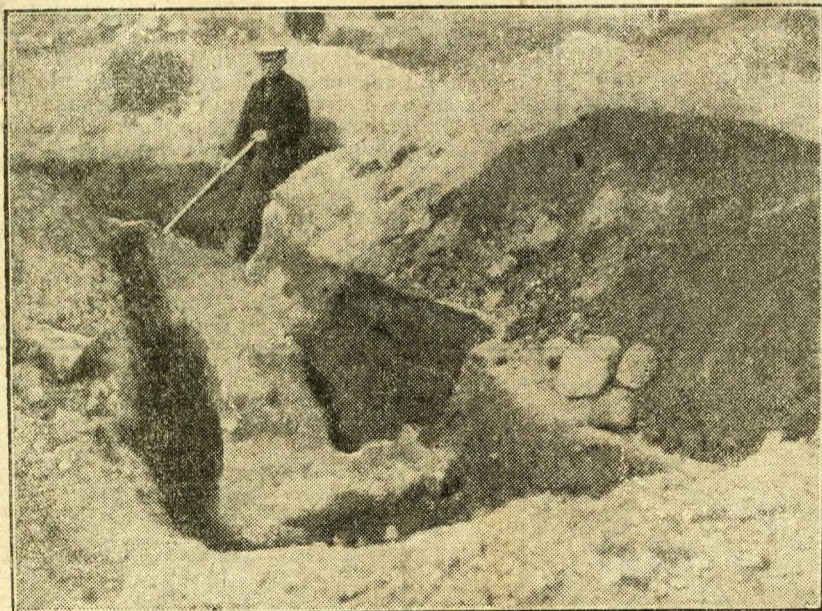
Régi római városrész föltárása az utépítés színhelyén.

a téglagyárak mit jelentenek Óbuda fejlődésének hátráltatása körül, arra legjobb bizonyíték az Ujlaki Téglagyár és Mészégető, amelynek területét a Hátár-ut, a Szőlő-utca, a Selmeci-utca és a Bécsei-hegyoldal jelentette, sőt a Kálvária alatt, a régi temető mellett is telepei voltak. Ezt a környékre állandó veszedelmet jelentő telepet nagy nehézen sikerül arra bírni, hogy parcellázzon, azonban hatalmas területeit a banktőke profitja olyan aprókra szabdalta el, hogy azokon emeletes házak és ezzel együtt befektetést érdemlő építkezések nem létesülhettek. A parcellázásból azonban ilymódon óriási összegeket vágtak zsebre. Följebb, a Bécsei-ut