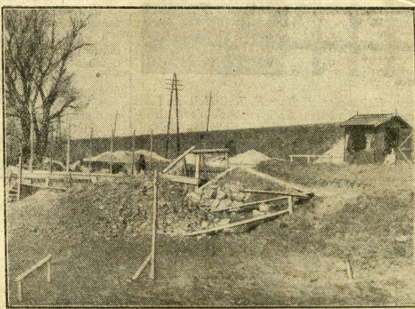
Modern transzverzális ut épül az ősi római város romjai fölött.

leti részét a Tiszától a Don folyóig. Amíg Etele a nyugati népek ellen harcolt, Buda megszegtette a szerződést és az Aquincum mentén létesült Sicambriában ütötte föl székhelyét, amelyet Buda várának neveztetett el. Etele Budát megölette és a helyet Attila városának nevezte el. Ebből lett a német Eitelburg ( Acilburg vagy Acingurg ), ami a régi Aquincum nevének világosan fölismerhető átalakítása.