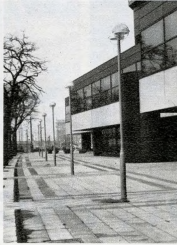
Új eljárással készültek a Duna-korzó járólapjai

A vállalatnak a díszítő termelése, feldolgozása és helyszíni beépítése volt korábban a fő tevékenységi területe. Ez később kibővült épületszobrász-ipari feladatokkal, valamint a műkökésztéssel. A vállalat jó munkájáért miniszteri kitüntetésben részesült, és nem volt olyan nagyobb építkezés — metró, Országház, budai Vár, Vigadó —, amelynél dolgozóink közül valaki ne kapott volna kiváló munkájáért magas állami kitüntetést. Büszkén vallhatjuk, hogy nincs hazánkban olyan helység,