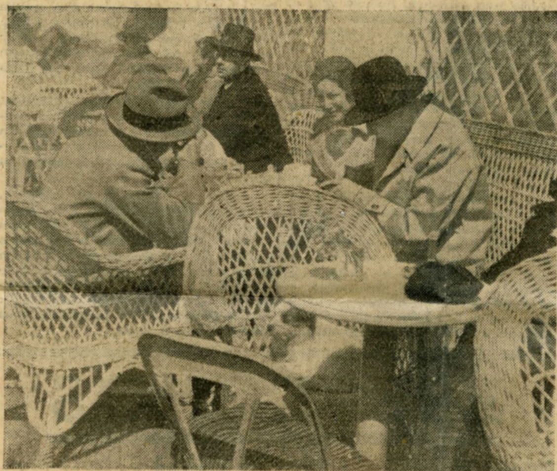
Terrasses de café à fauteuils confortables.

(De notre envoyé spécial Georges OUDARD)