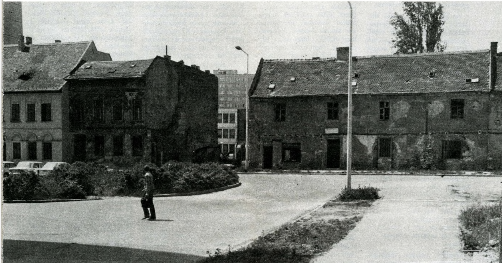
Középkori kereskedőház a Lajos utcában