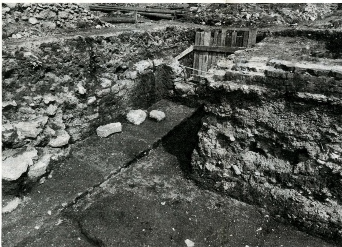
XIII—XIV. századi házak maradványai az Árpád-híd budai hídfőjének déli oldalánál