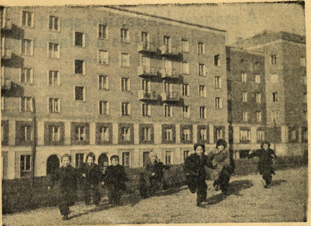
Vidám gyermekek a Harmat utcai új lakótelepen.

Mi nincs a kerületben? Táncolni a művelődési házakban lehet, de a vendéglátóipar üzemében nem. Köbányán nincs táncos szórakozóhely. Nincs kiállításra alkalmas hely sem. Hletve lenne, a Csajkovszkij-parki volt Dreher-kastély, ha a Keksz- és Ostyagyár igazgatósága visszamenne az üzembe, közelebb a termeléshez. Ehhez pedig az kell, hogy a volt igazgatósági épületből a lakókat máshová tegyék. És ez jó lenne mennél hamarabb, mivel az állandó kiállítási ternen kívül itt szeretnék elhelyezni a kerület múzeumát is.