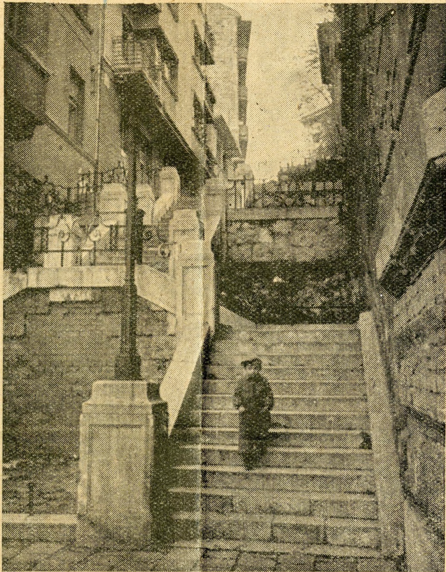
Vízivárosi kép. Ponty-utca

Amíg a nagytőke által irányított amerikai filmek és magazinok az adagolt nemiséget ontják, a Szovjetunió és a népi demokráciák művészeti élete a tiszta, az igaz szerelmet tartja eszményének és egyre inkább felszámolja a testi és szellemi értelemben vett teremtéstől elszakadt «pikantéria» maradványait. Új női típus alakul ki nálunk , — mondta nemrég egyik beszédében Románia nagynevű külügyminisztere, Ana Pauker — új női eszmény jelentkezik tehát fejlődő művészetünkben is. A lágyság és öntudat vegyüléséből bontakozik ki ez az új asszony, aki megállja a helyét az élet, a valóság dolgaiban, ugyanakkor azonban a legnemesebb, legmélyebb érzelmekkel van telve...» Azok a fiatal, sugárzó egészségű, erejű leányok, akik az egész világon, köztük a szabadságukért küzdő országokban; Spanyolországban, Görögországban, Kínában, Vietnámban és egyebütt népük haladásának élvonalában állnak, semmit sem vesztek bájukból és nőiességükből, mert nem pude-rezéssel, arcfestéssel és férficsábítással, hanem sajátmaguk és környezetük nevelésével vannak elfoglalva: Goethe által oly csodásan megzendített halhatatlan asszonyiság, a « das ewig Weibliche » ugyanis nem a csábítás, hanem a báj; nem a szerető, hanem az anya!... ANTAL GÁBOR