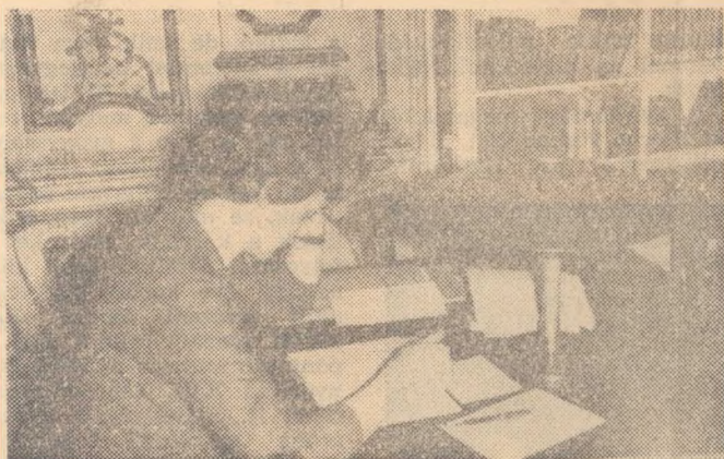
Szabó Ervin Könyvtár: saját jegyzet.