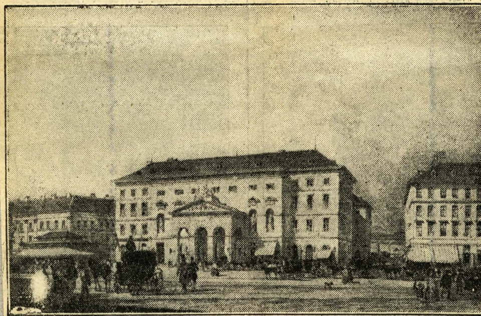
A pesti német színház, ahol pár nappal később kifütyülték