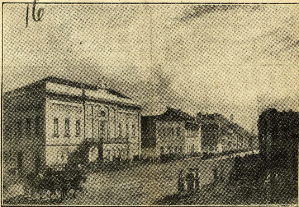
A pesti magyar színház, ahol Vieuxtemps sikert aratott

Galli Curci bukása után érdemes feleleveníteni egy régi pesti zenei botrány történetét, mely Vieuxtemps nevéhez fűződik. Persze ennek a skandalumnak egészen más okai voltak. Vieuxtemps akkor tudásának tetőfokán állott, tehát nem a közönség kritikai elégedetlensége pattantotta ki a tüntetést, hanem olyan motívumok, amelyek logikus következményei voltak a nemzeti öntudatra ébredés korszakának és annak a lelkiállapotnak, amelyben akkor Pest hazafias érzelmű magyar lakosága élt.